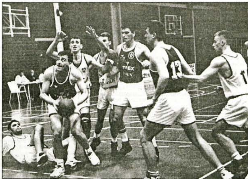
Košarkarji Triglava so leta opozarjali na slab pod v dvorani in na neurejene razmere v kranjskem športu, morda pa bodo z novo organiziranostjo vendarle uspeli stvari postaviti na svoje mesto.

Tako plavalci ugotavljajo, da bodo "preživeli" le, če bo občina pokrila njihove stroške v bazenu, košarkarji pa bi radi koncesijo v športni dvorani na Planini - Tudi ostali klubi visokih stroškov brez podpore družbe in uspešnega marketinga ne bodo zmogli