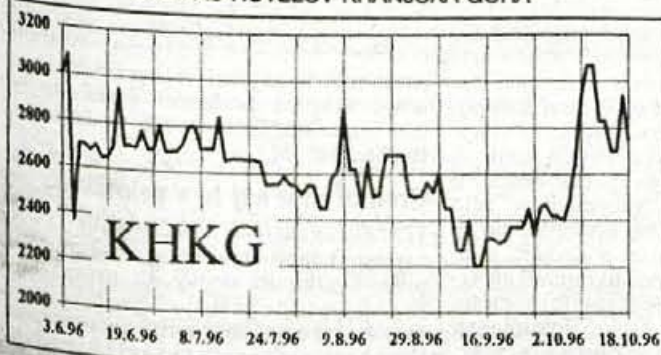
GIBANJE TEČAJA REDNIH DELNIC KOMPAS HOTELOV KRANJSKA GORA