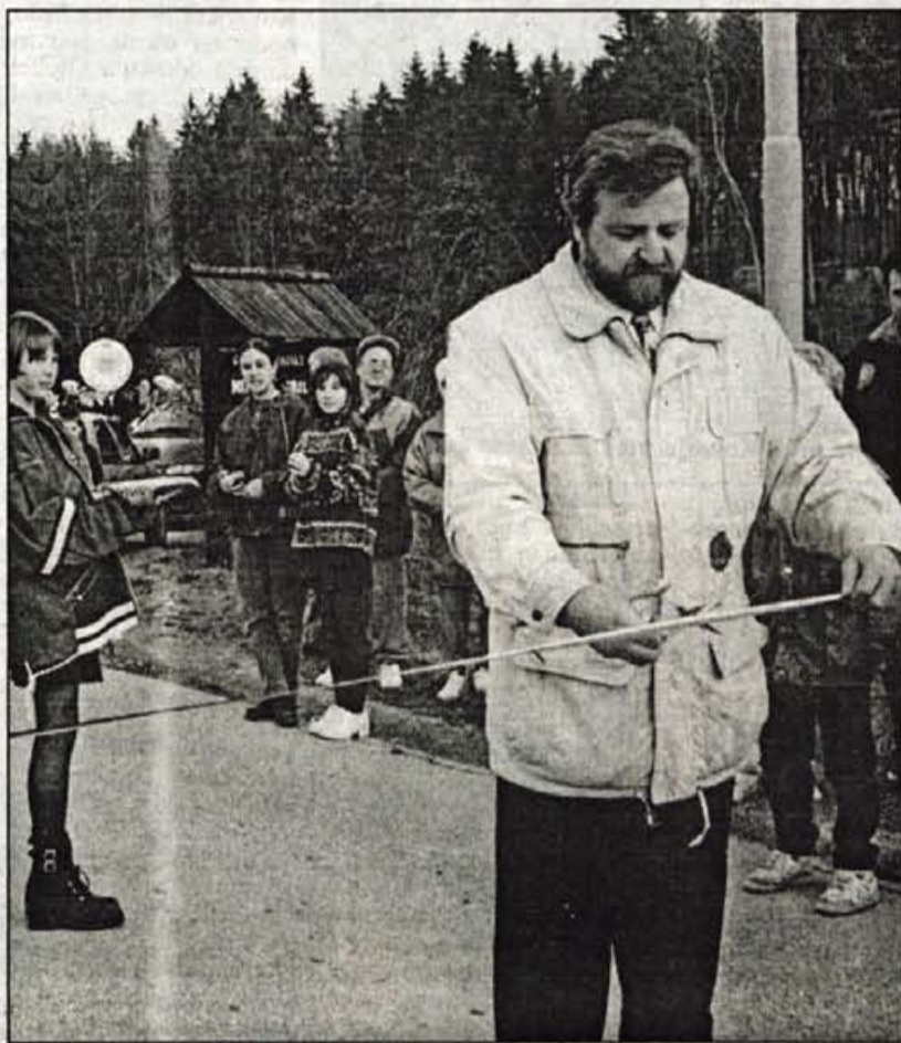
Ob prvem prazniku občine Kamnik so letošnjo pomlad odprli prenovljeno cesto Duplica - Volčji Potok.

Za vsak praznik je značilno veselje. Kot izgleda, na Gorenjskem tudi s to vrednoto varčujemo, saj so občinske praznike doslej izbrali le v sedmih od devetnajstih občin.