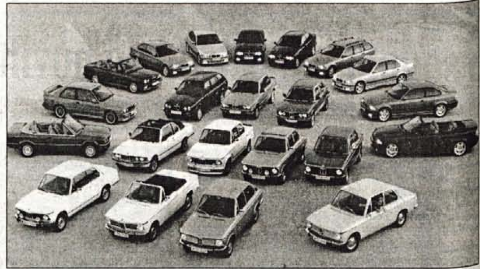
Evolucija 'majhnih' BMW-jev. Tisti spredaj so predniki onih zadaj, oni svetli desno spodaj pa je legendarni 1600 prvi med 'majhnimi'.

Prav to pa je bistvo serije 3. Tovarna BMW kupcu omogoči, da si iz osnovnega koncepta izbere sebi primeren avtomobil. 'Majhen' BMW je vse prej kot majhen, prej bi mu lahko rekli, da ni prevelik. Kupci z omenjeno serijo dobijo možnost, da avto prikrojijo svojim potrebam. • U.S.