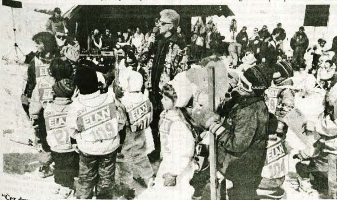
"Čez drugo prelomnico je dovoljeno tudi po riti..."