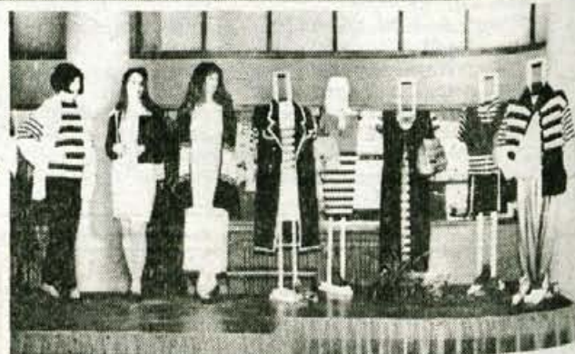
Modna revija ob informativnem dnevu.

programi in izobraževanjem po načelu 3 + 2 lahko napolnimo le 36. Ker za nekatere poklice zlasti v primarni tekstilni stroki že nekaj let zapored upada zanimanje, je v šoli manj učencev, zato že nekaj časa razmišljamo, kaj s prostimi zmogljivostmi. Letos smo dobili nov program, 2 oddelka za poklic frizerja, saj je tovrstna ljubljanska šola preobremenjena, šolsko ministertvo, ki odloča o mreži