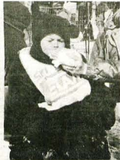
... in na kosilu pri mami

ljubljska Pivovarna Union. Slog je odločil tudi pri skokih, pardon poletih, z večjega in manjšega tobogana. Medtem, ko smučarji iz Elanove demo skupine na belih pobočji pričarali prednosti najnovejših Elanovih smučic SCX, pa so iz skoraj jasnega neba prileteli padalci ALC Lesce. Ja, tako lepo vreme je bilo v nedeljo na Voglu, da smo pogruntali tudi, kdo je bil glavni sponzor. Bog, jasno.