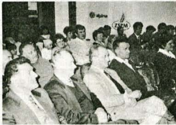
Med gledalci je bil tudi minister za kmetijstvo dr. Jože Osterc (drugi z leve).

Tema in literatura sta bili razpisani že prej, tako da so