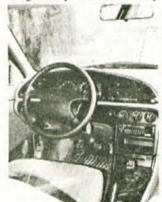
Notranost: sodobna, ergonomična, z neugledno plastiko.

Prostorna notranost, izdatne notranje obloge, ergonomično zasnovan volan, delovni prostor in oprema z oznako CLX, to pa je podaljšek tistega kar je vidno na zunan.