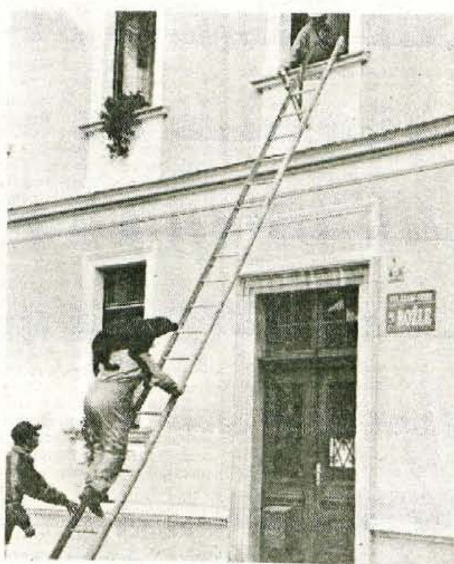
Člani reševalne enote radi prikažejo svoje veščine na vajah.

Prvo od letošnjih nalog je društvo že uresničilo, saj je konec minulega tedna pripravilo v Naklem predavanje o prehrani psov. Drugo predavanje za lastnike psov bo 23. februarja, ko bodo spregovorili o vzgoji in šolanju psa ter vpisovali v začetne tečaje. Tečajniki v mali šoli se bodo zbrali na društvenem vadišču 4. marca. Člani društva bodo sodelovali na tečajih za vodje