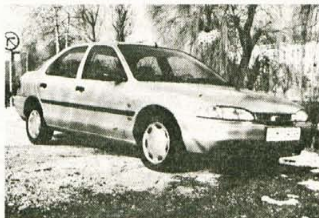
Ford mondeo: tudi v kombinaciji z dizelskim motorjem.

Pri uporabnosti je poleg kombijevske različice najmanj zahteven pri petvrtnem kombilimuzinskem mondeu.