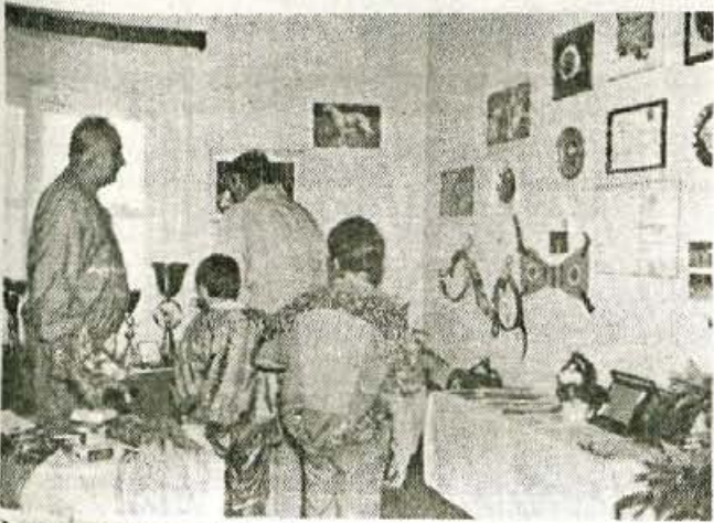
Lani so imeli kinologi odmevno razstavo ob dnevu Nakla.

šolanja vseh stopenj in markiranja po programu Kinološke zveze Slovenije, tekmovalne ekipe nadaljujejo s treningi in udeležbo na tekmovanjih, prav tako pa ima redne vaje reševalne enote. Vodstvo društva pa se že pripravlja na organizacijo 7. mednarodne razstave psov vseh pasem, ki si jih bo moč ogledati sredi junija na prostoru Gorenjskega sejma v Kranju. Tam ponovno pričakujejo okrog 1500 udeležencev, med katerimi so številni obiskovalci iz raznih evropskih držav. • Stojan Saje