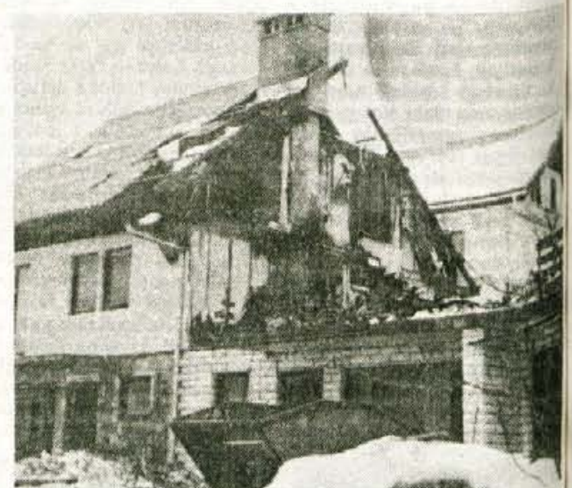
Jesenice zbirajo za pomoč prizadetim družinam Mandeljčevih Cej, ki jim je ob koncu lanskega leta pogorelo vse imetje...

Krajevna skupnost Hrušica, ki vodi akcijo pomoči, je morala počakati na izvedensko mnenje, predvsem izdelovalca montažnih hiš Jelovice iz Škofje Loke. Izvedenci so ugotovili, da je tudi dvojček Mandeljčevih popolnoma uničen. Kot svojo pomoč pri obnovi je Jelovica za enojni objekt, ki naj bi ga postavili s solidarnostnimi sredstvi ne le Jeseničanov, ampak tudi firm in drugih, namenila kar izdaten popust. Objekt naj bi stal 4 milijone tolarjev, s tem, da nudi Jelovica 25 odstotkov popusta. Seveda gre le za postavitev stavbe oziroma hiše, ne pa tudi za instalacije. Z Jelovico