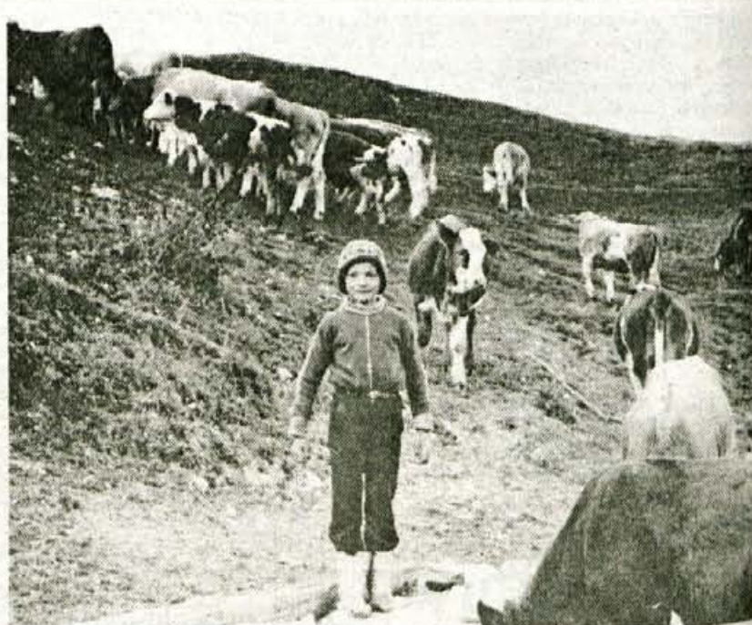
Država denarno podpira le urejeno pašo.

Država bo tudi letos spodbujala obnovo črede plemenskih krav s kakovostnimi privesnicami in plemenskimi brejimi telicami kombiniranih in mesnih pasem iz lastne reje ali iz nakupa. Do regresa so upravičeni rejci plemenskih krav - privesnic kombiniranih in mesnih pasem in kupci, ki kupujejo breje plemenske telice prek živilorjske selekcijske službe. Pogoj za