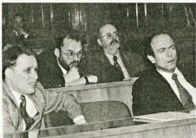
Predsednik in ministri.

V drugi obravnavi pa bodo poslanci obravnavali predlog zakona o telekomunikacijah, predlog zakona o poštni dejavnosti, predlog zakona o lastniškem preoblikovanju Loterije Slovenije in predlog zakona o Uradnem listu. V proceduro pa prihaja tudi predlog zakona o spodbujanju regionalnega razvoja.