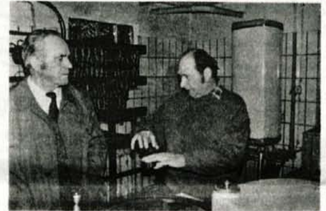
Predelava mesa pri Zörglovih.

številni turisti, ki jih poleg kvalitete privlači tudi lepa embalaža. Žganjekuho v Avstriji nadzoruje urad za finance, ki mu je potrebno za vsak liter čistega alkohola plačati 53 šilingov davka.