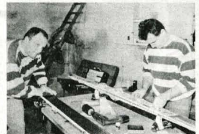
Novi predpisi o dolžini in montaži vezi na skakalnih smučeh so mariskomu zagrenili začetek sezone, naši serviserji pa so se tokrat v Planici izkazali z odlično pripravo in zanesljivo (na milimetre natančno) montažo.