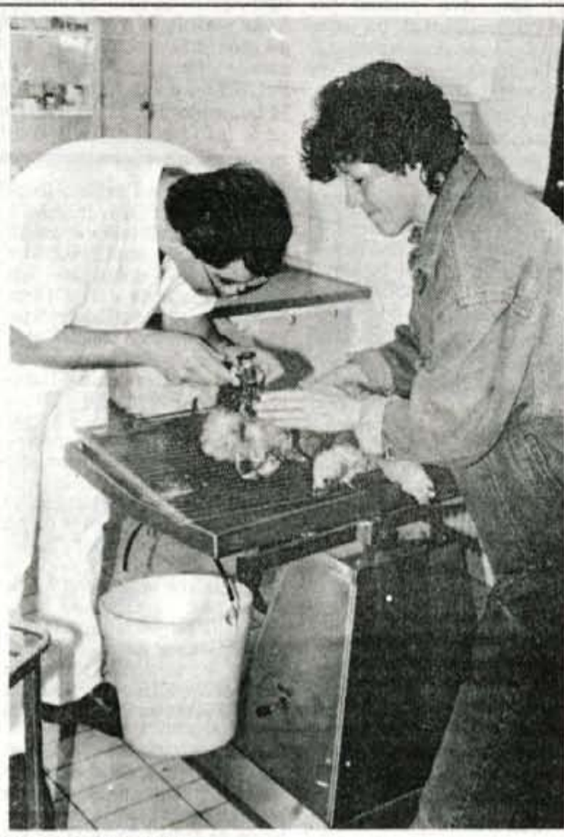
Veterina pri delu

"Objavljeni čas trikrat na teden po tri ure že zdavnaj ne zadošča več. Zato smo prešli na sistem naročanja po telefonu. Na tak način, da večina pride naročena ob vnaprej dogovorjeni uri, se izognemo čakanju v čakalnici, ki za lastnike živali ni prijetno, še manj pa za živali same. Potrebe so pokazale, da je potrebno delo vsak dan, pa še tako se včasih v objavljenih urah napravi gneča."