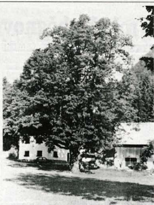
Gogalova lipa v Radovni - Gogalova lipa v Zgornji Radovni je ena največjih in najlepših lip v Triglavskem narodnem parku in je po nekaterih virih stara 800 let, po drugih pa 600 let. Gogalova lipa je zaščitena kot naravna znamenitost, domačini pa pravijo, da je v zadnjih desetih letih povečala svoj obseg za najmanj 30 centimetrov. Ko so tudi v Radovni začeli z intenzivnim gnojenjem, se je odebelila tudi Gogalova lipa...

Zato se dogovarjajo za dodatna finančna sredstva, ki bi jih dodelili tistim institucijam in organizacijam, ki bi na podlagi javnega razpisa imele najprimernejši program za interesne zaposlitve čimvečjega števila otrok.