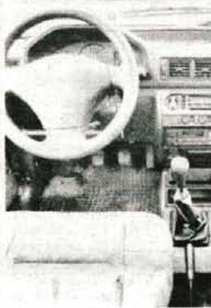
Potniški prostor: udobje, dobra oprema in neugledna plastika.

CENA do registracije: 23.350 DEM (Summit Motors, Ljubljana)