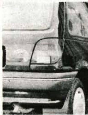
Zadek: povprečen družinski prtljažnik

Če bo dovolj zanimanja, bo kopalni vlak iz Maribora do Kopra vozil vsako soboto do konca počitnic. • M.G.