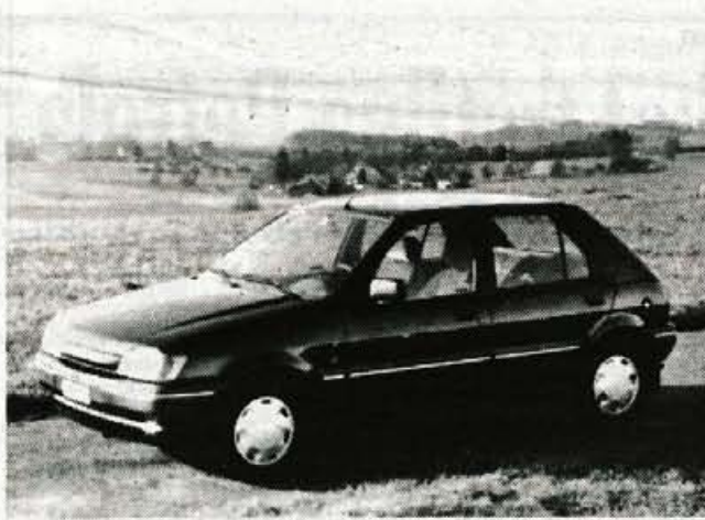
Ford fiesta 1.4 ghia: še vedno privlačen avtomobil

Fiesta z opremo ghia je trenutno edina, ki ima pod motornim pokrovom 1,4-litrski štirivalnik z močjo 70 KM. To je preizkušen agregat v letošnjem modelu zaradi boljše izolacije nekaj tišji, precej prožen in nekoliko neodločen pri hitrem pospeševanju in za malenkost prešibek za spodobnejšo končno hitrost. Lega na cesti je pri tem avtomobilu dobra, ne pa povsem zadovoljiva, česar so delno krive tudi zavore, ki so