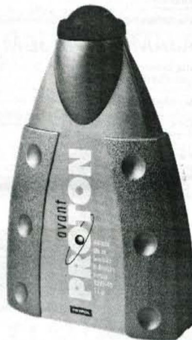
PROTON Top Sint 5W-40

Motorna olja PROTON so izdelana s pomočjo najsodobnejše tehnologije in po kakovosti dosegajo najboljše znamke motornih olj, saj ustrezajo specifikacijam ameriškega naftnega inštituta (API) ter zahtevam in specifikacijam najuglednejših svetovnih proizvajalcev motornih vozil. V družino PROTON spadajo štiri olja.