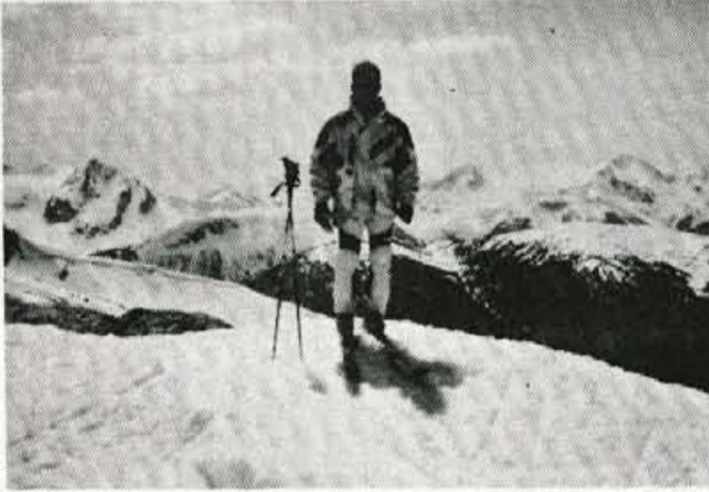
Si šel v Ameriko s trebuhom za kruhom?

Ali imate kakršnokoli sposobnost, s katero se lahko povežite? Potem greste lahko v Ameriko in jo mogoče celo dobro vnovčite. Če ne, pa si nabereite veliko izkušenj, spoznate nove ljudi in v primeru, da se vrnete v domovino, to za vedno ostane čudovito obdobje vašega življenja.