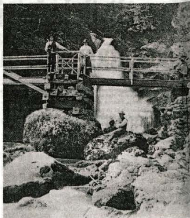
Ko so pred sto leti odkrili lepote soteske Vintgar, so navdušeni Gorjanci v soteski začeli graditi mostove za lažji prehod. Teh mostov danes ni več, zgradili so nove...

Ob poti, ki pelje iz Spodnjih gorij na Blejsko Dobravo skozi Strmo stran, sta se spustila navzdol do Radovne. Reka se je z mogočnim šumenjem valila čez velike skale ob navpičnih in z ledom prevlečenih stenah, na katerih so bile velike ledene sveče. Nista mogla prodreti daleč, a vendarle sta napravila nekaj le-