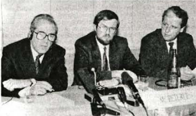
Zasedanje Evropske demokratične unije - Ljubljana, 30. januarja - V soboto je v Cankarjevem domu zasedal izvršilni odbor Evropske demokratične unije - zveze demokratičnih in konzervativnih strank evropskih držav. Uniji predseduje avstrijski minister za zunanje zadeve dr. Alois Mock, gostitelji tega srečanja pa so bili Slovenski krščanski demokrati. S.Z., Slika: G. Šinik

zadovoljen, je dejal, da so v EDU do ženevskih pogajanj o reševanju krize v nekdanju Ju-