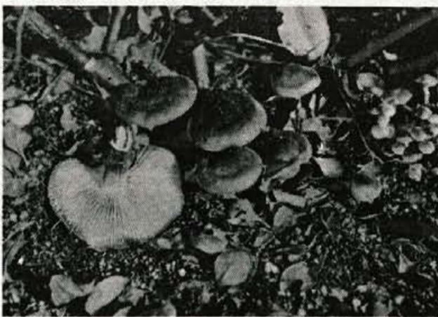
Zimske panjevke, posnete 26. januarja 1993 na Planini pri Kranju.

Lansko leto je bilo za ljubitelje gobarjenja polno presenečenj. Junija so se še lahko veselili poletnih gobanov, golobic, lisičk, potem pa je pritisnila nezgodna vročina. Julija in avgusta so se gobe dobesedno skrile. Pravi gobarji so se morali podati še globlje v gozd. Samo v močvirnih krajih in na osončnih bregovih so še lahko napolnili svoje košare. Organizatorji razstav so bili močno zaskrbljeni, saj so konec septembra našli v naravi le nekaj nad 50 različnih vrst gob.