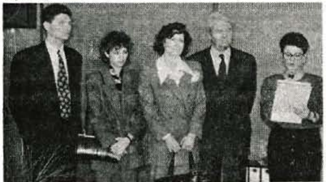
Družina Zalokar iz Šentvida nad Ljubljano uspešno vodi svoje mizarstvo, ki se ponaša z več kot stoletno tradicijo.