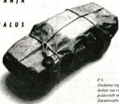
P.S. Dodatne informacije dobite na vseh poslovnih mestih Zavarovalnice Triglav.

Vseh ugodnosti, prednosti in koristi, ki jih prinaša nova ponudba ZAVAROVALNICE TRIGLAV, je toliko, da si boste želeli imeti avto samo zato, da bi ga lahko zavarovali.