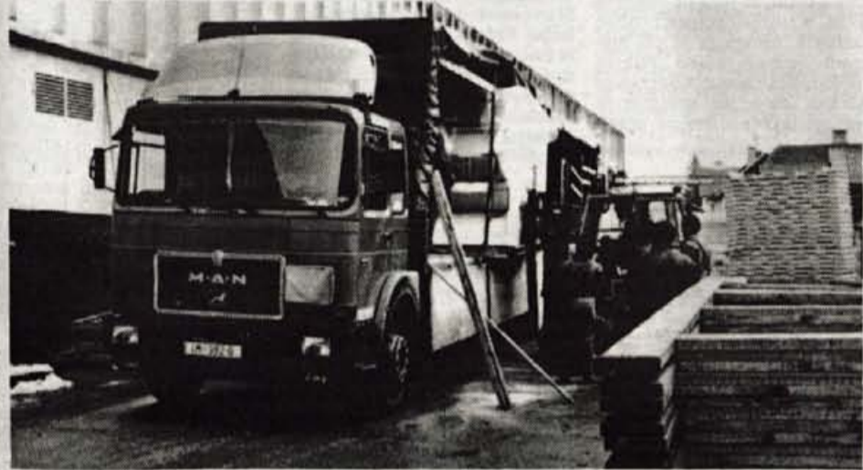
Škofjeloška Jelovica je v BiH poslala prve tri montažne objekte, v katerih bodo osnovne šole, postavili jih bodo na ključ.

Gorenjska Banka d.d. Kranj VARNOST ZA ZAUPANJE