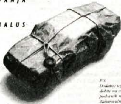
P.S. Dodatne informacije dobite na vsah poslovnih mestih Zavarovalnice Triglav.

Vseb ugodnosti, prednosti in koristi, ki jih prinaša nova ponudba ZAVAROVALNICE TRIGLAV, je toliko, da si boste želeli imeti avto samo zato, da bi ga lahko zavarovali.