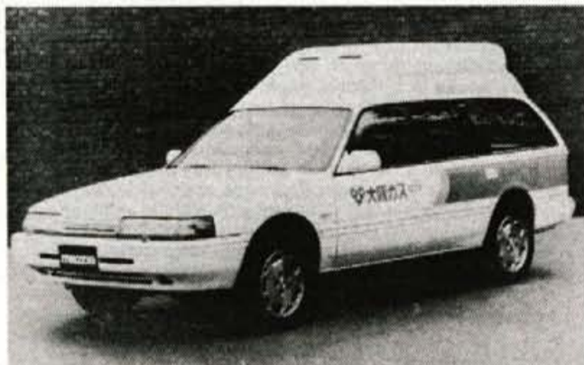
Mazdin prototip: inovativnost v praktični uporabi

Strokovnjaki japonske Mazde so pred kratkim končali z razvojem novega prototipa na osnovi mazde 626 kombi, ki se ponaša z motorjem, ki ga poganja zemeljski plin. Prvi rezultati testov z novim prototipom so tako glede motornih zmogljivosti, kot tudi porabe zemeljskega plina zelo obetajoči, saj je vozilo tudi postavilo japonski rekord, saj so z eno posodo goriva prevozili 330 kilometrov, kar doslej še ni uspelo nobenemu takšnemu avtomobilu. Pri tem je zanimivo, da so posodo za plin namestili v zato posebej razvito visoko streho, ki je sestavljena iz štirih posod valjaste oblike. Pri tem so ustrezno poskrbeli za zaščito, saj so posode narejene iz aluminijeve litine ter obdane z ojačano umetno snovjo, ter plaščem iz steklenih vlaken. V posodo je mogoče spraviti kar 24,8 kubičnega metra zemeljskega plina, ki ima kot vir energije prednost v doseganju zelo podobnih lastnosti kot avtomobili z bencinskimi in dizelskimi motorji. Poleg tega je pomemben pri varovanju okolja, saj je v izpuhu vozila s takšnim motorjem zelo malo ogljikovega dioksida.