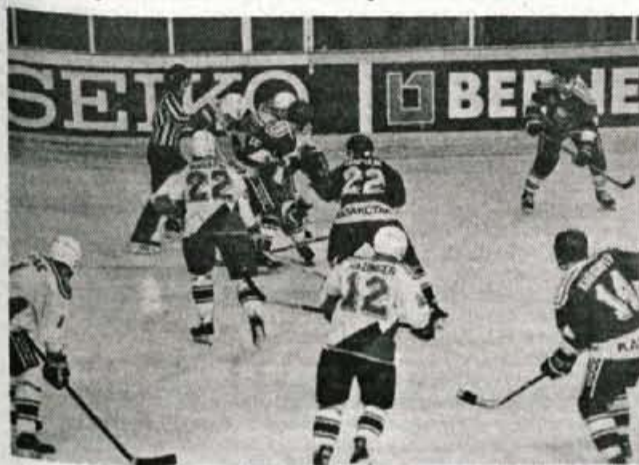
Naša ekipa se je na prvi tekmi s Kazahstanom dobro upirala favoritnim tekmečem, v tekmi za tretje mesto pa so imeli premalo moči in motivacije.

Potem ko so naši hokejisti v četrtek zvečer v ogorčenem boju premagali ekipo Kazahstana, so jim v polfinalni tekmi z Latvijo pošle moči - Četrto mesto ni razočaranje, upanje na čimprejšnjo uvrstitev v boljšo skupino pa dajejo le morebitna nova pravila mednarodne hokejske zveze.