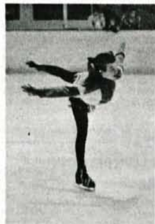
Mladi drsalci in drsalke so pokazali veliko znanja.

Uspeh slovenske reprezentance, ki je v trajno last prejela pokal "Triglav Trophy" pokroviteljstva Radia Triglav Jesenice, je zagotovo zaslužen in velika spodbuda za nadaljnji razvoj drsanja pri nas. Sicer so bili na tekmovanju najboljši japonski drsalci, med domačimi, je z zmago dose-