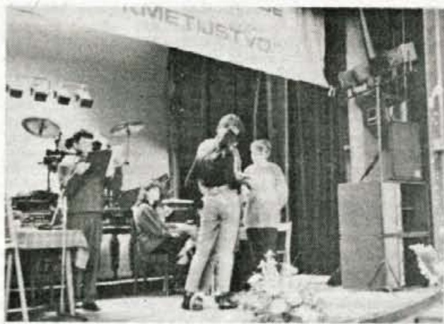
Tekmovalne ekipe so prikazale visoko stopnjo znanja o kmetijstvu.

Tekmovalne ekipe so poleg lanskoletnega državnega zmagovalca - ekipe Srednje mlekarke in kmetijske šole iz Kranja - prišle iz Cerklje, Naklega, Javorniškega Rovta, Trziča, Škofje Loke in Blejske Dobrave. Tekmovalna pravila so ostala enaka kot prejšnja leta, kar pomeni, da je bila za sodelujoče najvišja dopustna izobrazba srednja šola. Mladi iz podeželja o odgovarjali na vprašanja razdeljena v tri zahtevnostne stopnje. V prvi so bila vprašanja s področja sadjarstva in razvoja podeželja, v drugi s področja higienskega pridobivanja mleka, v tretji, najzahtevnejši, pa so odgovarjali na vprašanja o pomenu vrtnin v prehrani in o poljskih škodljivcih.