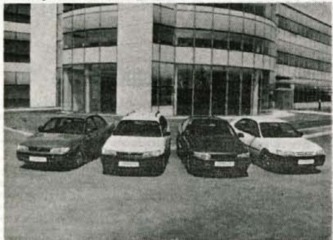
Novost lanskega leta: Toyota Corolla v vseh izvedbah