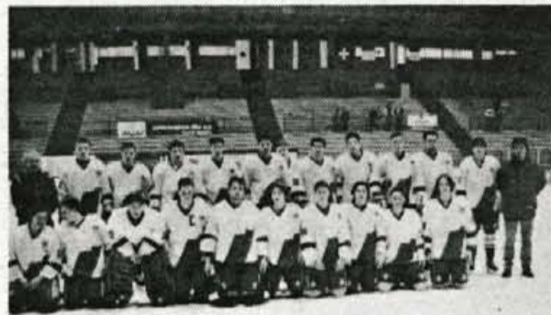
Naši mladinci na pripravah na Jesenicah.

Jesenice, marca - V času igranja svetovnega prvenstva "C" skupine na Bledu in v Ljubljani se je mladinska reprezentanca Slovenije marljivo pripravljala na Jesenicah za odhod na svetovno prvenstvo v Rigi. Naša mlada ekipa računa na ponovitev, ki so jo dosegli na zadnjem svetovnem prvenstvu v Španiji, to pa je boj za srebrno kolajno.