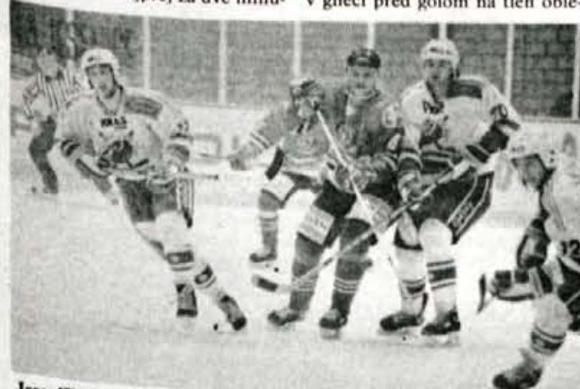
Jeseniški hokejisti so dobro branili domača vrata, z nekaj sreče pa so si v odločilnem podaljšku priborili zmago.