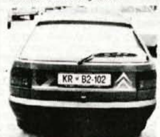
Zadek: spogledovanje s konkurenco

Pri tem je ZX tudi na slabši cesti dolgo časa nevtralen avtomobil, ki ga je težko spraviti iz ravnotežja. Pri dobri legi mu bistveno pomaga pasivna zadnja prema, pa tudi zavore s svojo učinkovitostjo dajejo občutek varnosti in zanesljivosti.