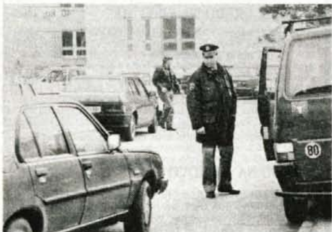
Običajna gneča pred zdravstvenim domom...

mestu opozorili 336 voznikov, deset voznikov, ki so kljub opozorilu napačno parkirali, so kaznovali na kraju samem, za brisalce vozil so zatakneli 77 obvestil, trinajstim voznikom napisali plačilne naloge, za štiri predlagali postopek pri sodniku za prekrške; dva zaradi neupoštevanja odredb policistov, dva pa zaradi grobega izsiljevanja pešcev. Kaznovali so tudi šest pešcev, ki so prečkali cesto zunaj prehoda. Razen policistov so bili ob dneva aktivni tudi komunalni redarji, ki so bdeli zlasti nad parkiranjem po zelenicah, okrog občine in Globusa. Redarji so izdali 59 obvestil o prekršku. ● H. Jelovčan, foto: G. Šinik