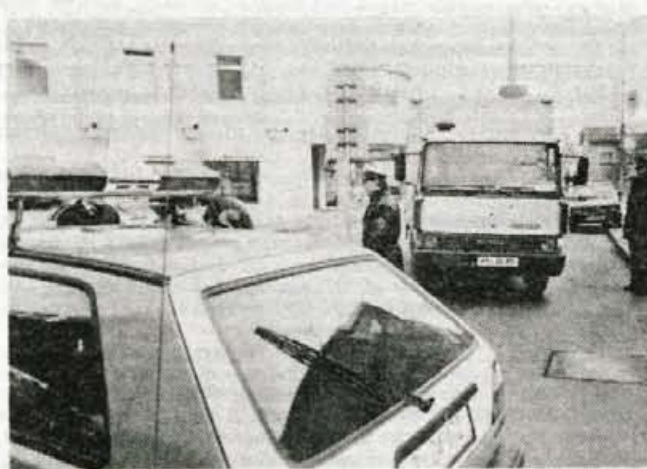
...in v mestu.

Policisti so še dognali, da je po mestu tudi zelo veliko nepotrebnih voženj od vrat do vrat, zlasti težko pešačijo sto metrov