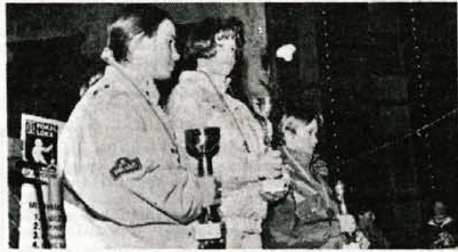
V praznično okrašeni Škofji Loki so v ponedeljek zvečer pripravili zabavni večer za mlade smučarje, najboljšim tekmovalcem in tekmovalkam pa je pokale izročil minister za šolstvo in šport ter predsednik častnega odbora 18. Pokala Loka Slavko Gaber.

V nedeljo je bil organiziran še veleslalom. V vseh štirih ka-