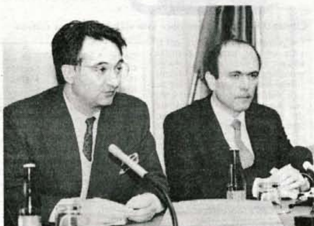
Predsednik Evropske banke Jacques Attali se je sestal s finančnim ministrom Mitjem Gasparijem, s predsednikom Milanom Kučanom in s predsednikom vlade dr. Janezom Drnovškom, ki ga je povabil na obisk.

V Mednarodni denarni sklad sta bili doslej sprejeti Slovenija in Hrvaška, v Svetovno banko pa je bila Slovenija sprejeta prva in zdaj v njej bivše Jugoslavije ni več. Razdeljeni so bili seveda jugoslovanski dolgovni v Svetovni banki, ki so ob koncu lanskega leta znašali približno 2 milijardi dolarjev. Slovenski delež je 5-odstoten in tako znaša približno 100 milijonov dolarjev. "Odprihi" je le 900 tisoč dolarjev starega posojila, ki ga je prejela tedanja Beobanka in odstopila Elanu in Peku.