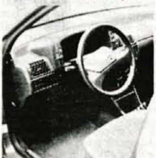
Notranost: udobje in veliko plastike

Karoserijske poteze so lepo skladne tudi s tistimi, kar pričakuje voznika in sopotnike v notranosti: prednja sedeža sta čvrsta, dobro prilagojena in nastavljiva, dobra prostorska izkoriščenost se čuti tudi zadaj in v