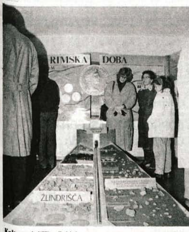
Kulturna dediščina Bohinja - Ob radovljiškem občinskem prazniku - na dan rojstva Antona Tomaža Linharta so v Muzeju Tomaža Godca v Bohinjski Bistrici odprli zbirko Arheološka najdišča in izročila Bohinja. Vrsta predmetov iz dosedanjih izkopavanj na različnih najdiščih v Bohinju, ponazoritev vetrne peči je predstavljeno na način, ki ne bo pritegoval k spoznavanju daljnega in preteklega življenja v Bohinju le šolske skupine, pač pa tudi vse, ki jih zanima življenje in kultura na naših tleh. L. M., foto: D. Gazvoda

Skupinsko zdravstveno zavarovanje s popusti imajo zdaj že upokojeenci, za svoje člane so jih izposlovali sindikati, tudi podjetja so za svoje zaposlene zagotovila nižje premije za prostovoljno zavarovanje, le najmanj privilegirana družbena skupina, brezposelni, so ostali izpostavljeni najvišji ceni tovrstnega zavarovanja. To praznino je sklenil izpolniti Svet kranjskih sindikatov, ki bo z zavarovalnico Adriatic sklenil ustrezno pogodbo o zavarovanju svojih brezposelnih članov. Brezposelnim premij ne bodo mogli odtegotovati, tako kot je to dogovorjeno za druge skupinske zavarovance, pač pa bodo zavarovalnico Adriaticu nakazovali posredno prek kranjskih sindikatov. Brezposelni bodo na ta način deležni 31-odstotnega popusta, kar je eden od razlogov, zakaj so prostovoljno zavarovanje vezali prav na zavarovalnico Adriatic. Drug razlog pa je dejstvo, da pogodbeni obveza te zavarovalnice ni pet let, tako kot drugod. Kranjski sindikati zagotavljajo, da ne bodo pobirali nobene provizije. Kar bodo storili za brezposelne, bodo le zaradi njih in svojega dobrega imena. ● D. Z. Žlebir