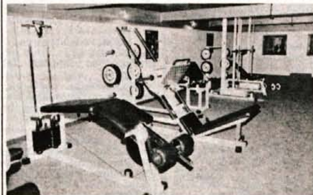
V Koritnem so poskrbeli za najboljšo fitness opremo.

Sicer pa v Koritnem vsa družina skrbi za dobro počutje obiskovalcev, zlasti poleti rade prihajajo družine, zato že gradijo tudi apartmaje za oddajanje gostom. Oddajati nameravajo tudi gorska kolesa, prav tako imajo v načrtu pripravljati tečaje namščine, vse to pa bi radi združevali z bližnjo ponudbo Šobca in Bleda. ● V. Stanovnik