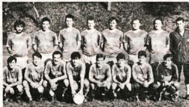
Nogometaši Visokega, jesenski članski prvaki gorenjske lige.

Člani A liga: Visoko 16, Sportina Bled 15, Lesce 15, Alpina 14, Tržič 14, Britof 11, Bitnje 10, Sava 10, Jesenice 9, Polet 9, Trboje 6 in Hrastje 3. Člani B liga: Mavčiče 19, Kondor 19, Železniki 17, Top Trade Reteče 16, Velesovo 13, Jesenice B liinden 83 13, Živila Naklo B 12, Podgorje 10, Podbrezje 8, Senčur 8, Alpina B 8,