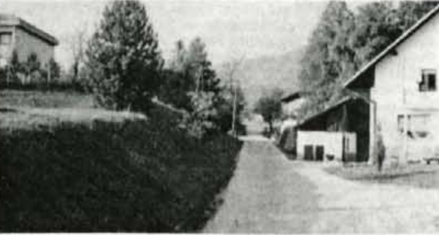
Nevarna pot (brez pločnika) v šolo.