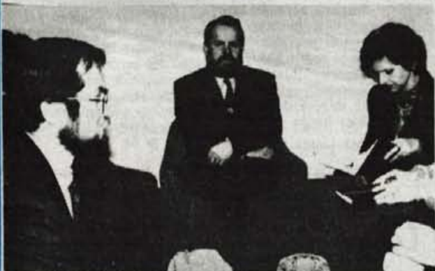
Predsednik slovenske vlade, Lojze Peterle, je bil v petek gost škofjeloškega izvršnega sveta.

Škofja Loka, 27. januarja - Predsednik slovenske vlade Lojze Peterle se je v petek s sodelavci odzval povabilu škofjeloškega izvršnega sveta. Po pogovorih s člani občinske vlade, kjer so največ besed namenili usodi Rudnika urana Žirovski vrh in divji privatizaciji družbenih podjetij, oziroma blokiran lastniški zakonodaji, so Ločani gosta povabili na ogled proizvodnje v hotaveljskem Marmorju in škofjeloškem Šesirju, Peterle pa se je sestal tudi z direktorji podjetij iz škofjeloške občine.