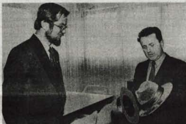
Med obiskom v tovarni Šesir: takšne klobuke bodo nosili naši reprezentanti na bližnji olimpiadi.