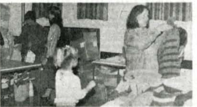
V Karitasu v Stražišču dvakrat na teden razdeljujejo pomoč.