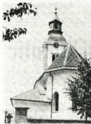
S sredstvi iz natečaja predvsem pa z delom in prispevki krajanov na Rupi obnavljajo tudi cerkev.

Ob živahni komunalni in društveni dejavnosti v krajevni skupnosti, ko skrbno pazijo na vsak tolar in ko skušajo tudi na tistih področjih pomagati krajanom, kjer so predvsem dolžne učinkovito posredovati občinske službe, jim ni vseeno, da se na