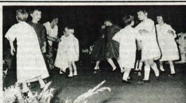
Folkloristi iz vrtca pri osnovni šoli Simon Jenko v Kranju.