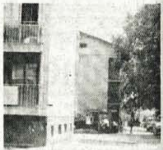
V Begunjski ulici so po vzorcu dosedanjega urejanja novih parkirnih prostorov v KS pred nedavnim uredili še eno parkirišče.

"Trenutno načrtujemo ureditev javne razsvetljave v Bertoncjevli ulici. Dokončanje akcije načrtujemo še letos. Z izdajanjem krajevnega gasila skušamo tudi redno obveščati krajanje o vseh dogajanjih, načrtih, proble-