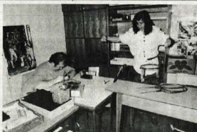
Varovanci v delavnici opravljajo svojim sposobnostim primerno delo.