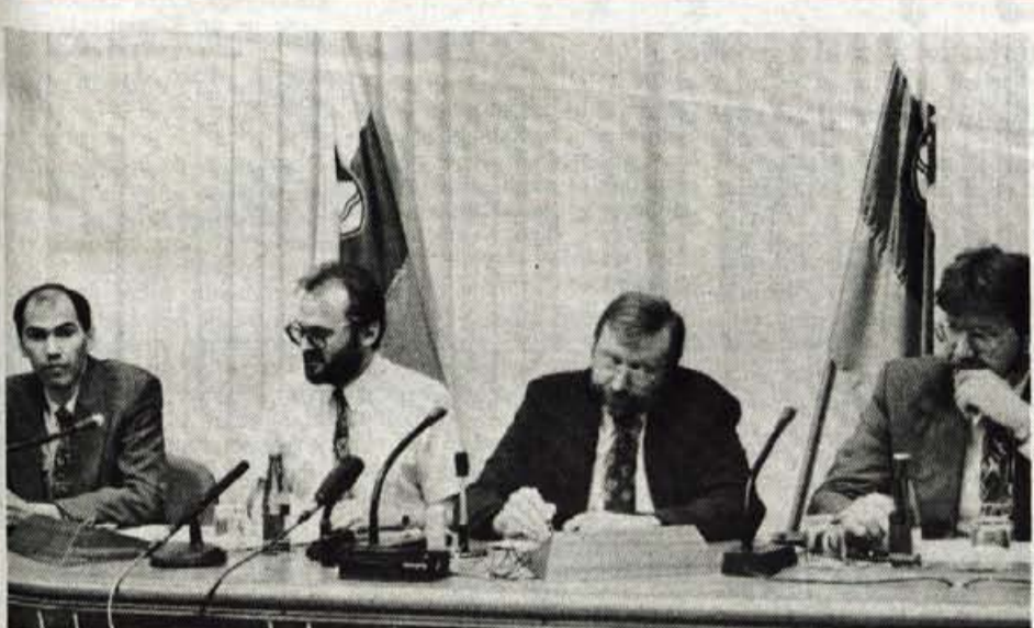
Obletnica odločilnih dni slovenske samostojnosti