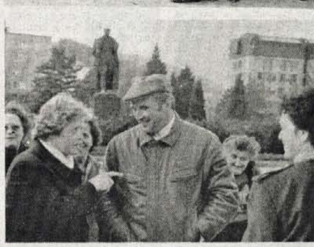
Topolišica, Velenje, Šoštanj, Mozirje, Gornji Grad, 3. in 4. aprila - Majhna je ta naša deželica, a na gosto posejana z lepimi in zanimivimi kraji. Česa vsega nismo ta dva dneva videli in doživeli! Topolišica nas je pričakala s šilcem, s kruhom in soljo, s pozdravom, kot se po stari slovenski navadi spodobi. Najbolj vneti so še isti večer skočili v bazen, drugi so se pa po večerji vrteli po narodnih višah. Drugo jutro so si nekateri glavo hladili v bazenu, drugi pa smo si jo raje razjasnili na ogledu po Velenju. Naj vam povemo, da Titov spomenik še stoji, čeprav

VZGOJNO-VARSTVENI ZAVOD TRŽIČ Svet Vzgojno-varstvenega zavoda Tržič razpisuje dela in naloge RAVNATELJA Pogoji: Kandidat mora izpolnjevati splošne pogoje, določene z Zakonom o vzgoji in varstvu predšolskih otrok, in imeti: — opravljen strokovni izpit — najmanj 5 let delovnih izkušenj, od tega najmanj 2 leti dela pri vzgoji in varstvu predšolskih otrok — strokovne in organizacijske sposobnosti Ravnatelj bo imenovan za 4 leta. Kandidati naj pošljejo prijave z dokazili o izpolnjevanju pogojev v 10 dneh po objavi razpisa na naslov: Svet VVZ Tržič, Šte Marie aux Mines 28. O izbiri bodo obveščeni v 30 dneh po objavi razpisa.