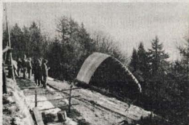
Dobrča, 5. januarja - Praznike in lepo sončno vreme je treba izkoristiti do konca, so si dejali tako planinci kot jadralni padalci in se povzpeli na številne gorenjske vrhove. To nedeljo so živopisana jadra z vrha Dobrčice poletela kot po tekočem traku. Nekajkrat je najbolj neučakane zaneslo, a k sreči se je vsaj tu gori vse dobro končalo.

70 ljubljanska banka Gorenska banka Kranj GORENJSKA BANKA FORMULA PRIRANKA