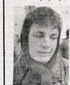
prej bolje. Med našimi tekmovalci trenutno navijamo za Kunca, med tujimi pa seveda za Tombo."

Med množico obiskovalcev v Kranjski Gori smo za mnenje o tekmovalju povprašali tudi gledalce.