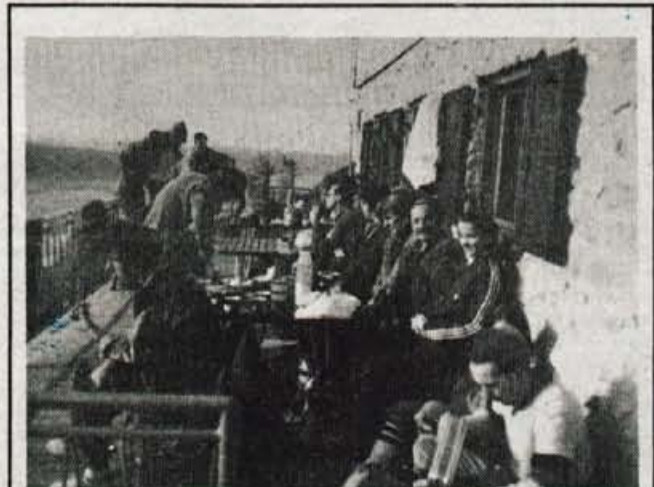
SPROŠČENI PRAZNIČNI DNEVI V GORAH - Mila in s snegom skopa zima omogoča vsem ljubiteljem planinarjenja, da obiščejo vsaj lažje dostopne postojanke. Tako tudi med prazniki kočje niso samevale. Terasa pred Domom Kokrškega odreda na Kališču, kjer so med prazniki našli blizu 500 obiskovalcev, je množici ponujala priložnost tudi za sproščeni počitek na soncu. Žal se za vse obiskovalce gora izlet ni končal dobro, saj poti na višje vrhove skrivajo nepredvidnim številne nevarnosti. ● S. Saje, foto: F. Ekar