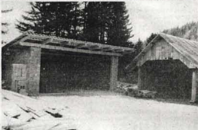
Lani so na Remontu zgradili pokrito lopo za stroje. Imajo že prikolico in cisterno za čiščenje gnojnih jam, zdaj pa čakajo še cepilnik za cepljenje drv za potrebe krajanov.

V letu, ki se začne, imajo v krajevni skupnosti spet načrte, ko bodo morali vsi skupaj krepko prijeti za delo. Dokončati nameravajo mrliške vežice, za kar so material že nabavili, zgraditi avtobusno postajo in urediti ter asfaltirati "Korejsko cesto". ● A. Žalar