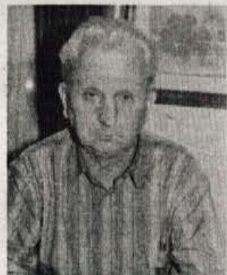
plačujemo v obliki davkov, takih in drugačnih. Tega se moramo zavedati.

Trg bi se moral stabilizirati, država bi morala poskrbeti za finančni red, kar je predpogoj dobrega gospodarjenja. Glede na skromen dohodek, ki ga trenutno ustvarja slovenska država, bi se morala javna poraba zmanjšati. Za obrt je rešitev v trdem delu, skromnosti in prilagajanju trenutnim razmeram na trgu. Skušati je treba preživeti obdobje, v katerem smo, preživeti slabe gospodarske čase. To leto bo v bistvu čas preživetja. Nobenih večjih investicij si ne bo mogel obrtnik privoščiti. Pred ureditvijo tržnih razmer jih resnično ne bi nikomur priporočal. Dokler se država zadožuje, državljanji to