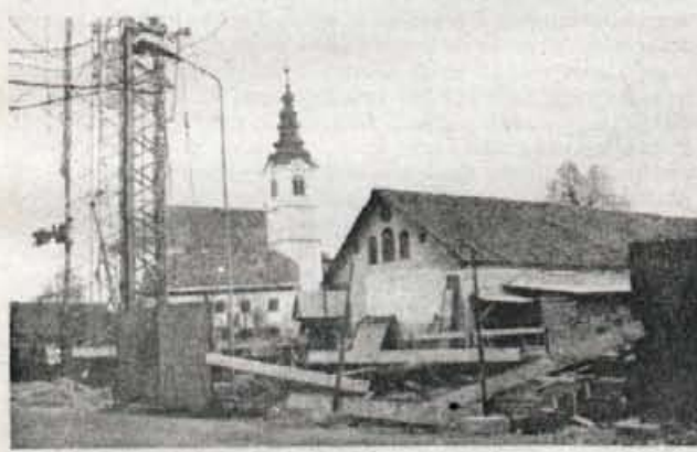
Nova pošta v Senčurju - Program krajevnih skupnosti Senčur v kranjski občini za letošnje leto so sprejeli. Kako obširen in zahteven bo, je ta trenutek še težko napovedati, vendar pa so minuli mesec ob prazniku krajevnih skupnosti v vodstvu krajevnih skupnosti našli kar precej stvari, ki bi jih veljalo opredeliti v programu. Lotiti bi se bilo treba popravila strehe, žlebov in obrob na strehi Doma Kokrške čete ter tudi fasade in notranje ureditve prostorov. Med prednostnimi nalogami je že zdaj omenjena tudi dokončna ureditev novega stanovanjskega naselja. Precej dela imajo tudi še na cestah, javni razsvetljavi, kanalizaciji, urejanju meteoritnih voda. Dolgoletna želja je tudi ureditev oziroma asfaltiranje ceste Senčur - Visoko in ureditev potoka Olševnica. Sicer pa bodo v krajevni skupnosti dobili tudi novo pošto. Gradnja le-te (na sliki) se je že začela. - A. Ž.

Krajevna knjižnica - Ljubno - V začetku minulega meseca, v okviru kulturnih prireditev v počastitev praznika v občini Radovljica, so v Ljubnem ponovno odprli prenovljeno krajevno knjižnico. Zdaj knjižnica domuje v primernejših prostorih in sicer v stavbi podružnične osnovne šole. Ljubenci so bili pred leti med najbolj pridnimi izposojalci, vendar pa je zaradi slabih prostorskih pogojev nekako tudi zanimanje za branje upadlo. Zdaj je v prenovljenih prostorih knjižnica tudi precej bogatejša z novimi knjigami. ● (jr)