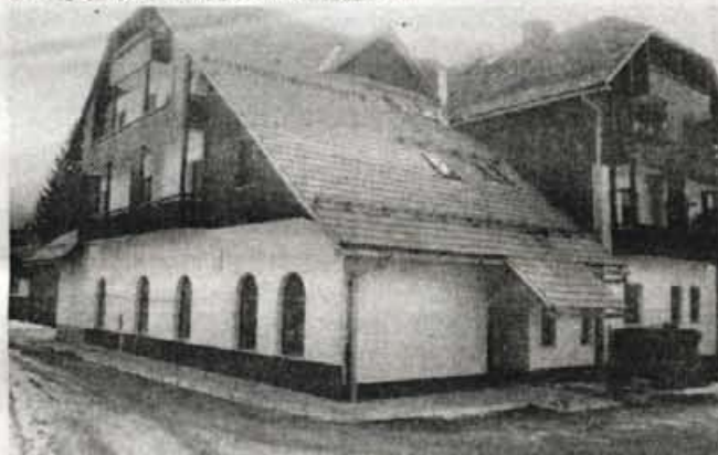
Pri kulturnem domu Korotan so lani uredili pločnik in položili asfalt ter tlakovali prostor pred ambulanto.