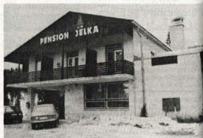
Penzion Jelka je bil več let zaprt, sedaj pa zaradi neurejene kanalizacije v okolici neprijetno zaudarja.

Društvo za boj proti raku v okviru akcije "Slovenija 2000 in rak" pripravlja vrsto novosti, ki naj bi pomagale k preventivi, spoznavanju bolezni. To so med drugim prosojnice, ki jih bodo dobili vsi predavatelji. Organizatorji si namreč močno prizadevajo, da bi bilo po Sloveniji organiziranih čim več predavanj o zgodnjem odkrivanju raka, predvsem naj bi zanje uporabili roditeljske sestanke po šolah; vsaka družina bi tu dobila tudi zloženke. Ravnokar pripravljajo novo, ginekološko zloženko, uredili pa bodo tudi brošuro, kjer bodo združene vse do sedaj izšle zloženke. V okviru akcij "Evropa 2000 in rak" je izšla tudi videokaseta, ki v obliki filmske risanke skuša obolenje za rakom približati tudi otrokom. Zveza društev za boj proti raku to video kaseto ravnokar pripravlja v slovenski verziji. Dodana ji je anketa o kajenju in obrazložitve, kaj je rak. ● D. Dolenc