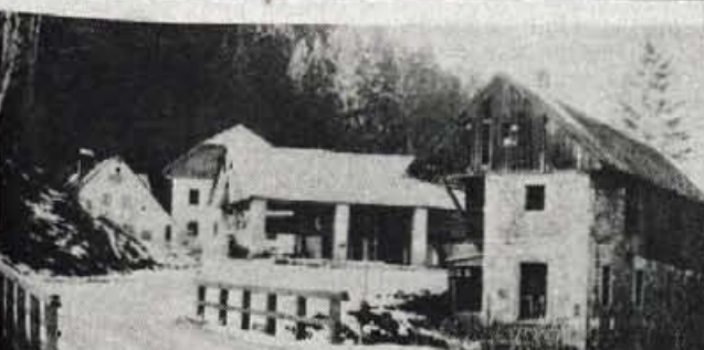
Nekako na sredini - Davča št. 35, Podporezen št. 1: osem kilometrov regionalne makadamske ceste Podrožje - Petrovo brdo.

Klic v silbi bodo v Ljubljani, v vladnih resorjih težko slišali po telefonu, ker cena zanj v Baški grapi ni 19 tisoč tolarjev, kot v Ljubljani. Morda pa ga po pogovoru z domačini minuli teden ne bodo prestišali in pozabili, kajti ob letu naj bi se v Baški grapi spet dobili. ● A. Zalar