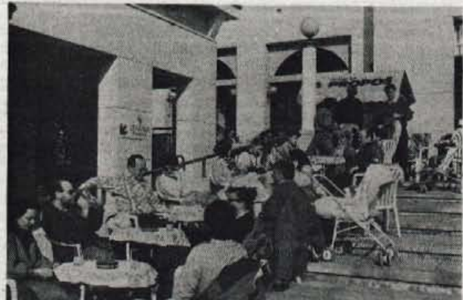
Bled, 1. marca - Prelepo vreme je konec tedna privabilo v naravo mnoge sprehajalce, dobro pa so bili obiskani tudi naši turistični centri. Avstrijci in Italijani so izrabili zanje ugodne cene ter "napolnili" avtomobilske tanke in želodce, domačini pa smo sončne žarke izkoristili za sprehode in nabiranje regrata. Čeprav se te dni še obeta lepo vreme pa se mnogi bojijo, da mraza za letošnjo zimo še ni konec.