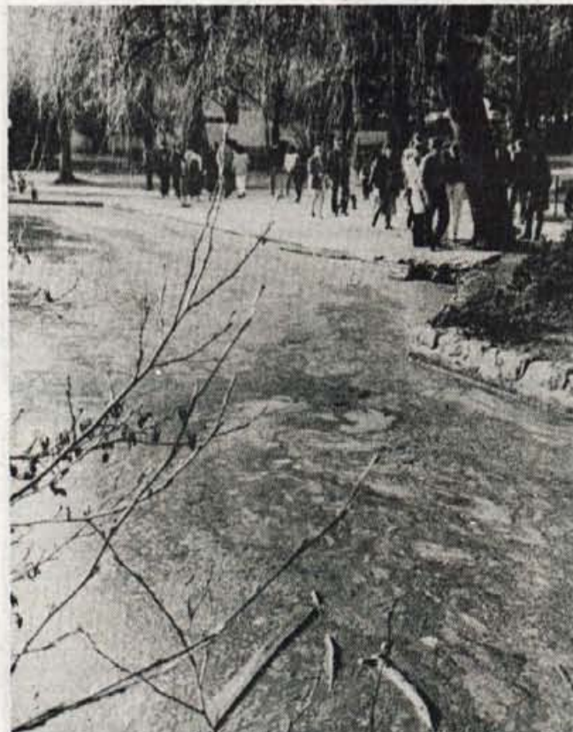
Blejsko jezero spet cveti - Konec tedna je množica turistov pa tudi domačinov obiskala Bled. Mnoge je v oči (in nos) spet zbudila sluzasta umazanija na blejskem jezeru. Ta je sicer posledica vsakoletnega cvetenja alg, ki se pojavi ob toplejšem vremenu (letos pa mraza ni bilo niti toliko, da bi alge popolnoma izginile pod ledom), vendar, kljub temu da bo umazanija do poletja potonila, na pogled vse skupaj ni nič kaj prijetno. V. S.

Zaradi napačno narejene greznice se po Pokljuki še kar širijo neprijetne vonjave