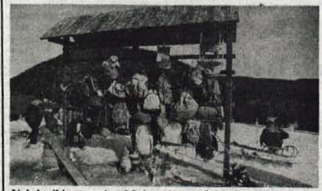
Nahrbtniki samejajo - Medtem ko smučarji vijugajo po zasneženih planjavah Soriške planine, njihovi nahrbtniki, dopoldne še polni malice, čakajo na urejenem počivališču.