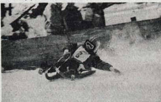
Borut Kralj iz Tržiča je bil tretji med mlajšimi pionirji.

Sicer pa slovenski sankarji na naravnih progah letos uspešno nastopajo tudi na medna-