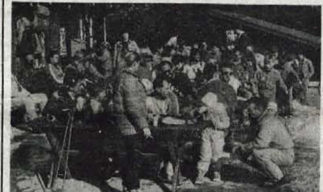
Gneča na smučiščih - Lepo sončno vreme je konec tedna na smučišča privabilo mnoge smučarje. Čeprav so bila smučišča lepo urejena, pa je snega vedno manj. Kljub temu pa je lepo posejati ob planinskih kočah. Tudi na Soriški planini so mnogi uživali ob lepem vremenu in dobri postrežbi.