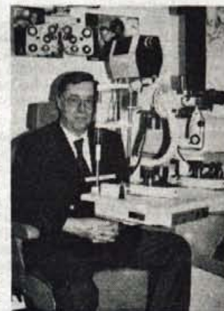
Optik Debeljak ob prvem aparatu za vrhunsko preiskavo oči na Gorenjskem.

Ta sogovornikova kritika ne skriva slabega namena, ampak prej poziv k boljsemu sodelovanju v korist pacientov. Zeli