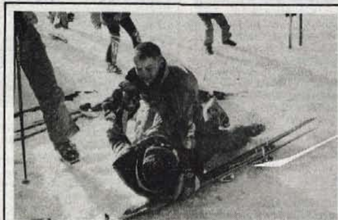
Soriška planina, 9. februarja - Ob letošnjem Pokalu Loka so se zbrali mladi smučarski upi iz enajstih držav sveta. Tekmovanje, ki pomeni več kot le športno tekmo, saj ima namen druženja mladih in predstavitev Skofje Loke kot turističnega kraja, je prineslo največ uspeha domačim, slovenskim tekmovalcem, mladi pa so se v prekrasnem sončnem vremenu ob tekmovališču znali tudi poveseliti.