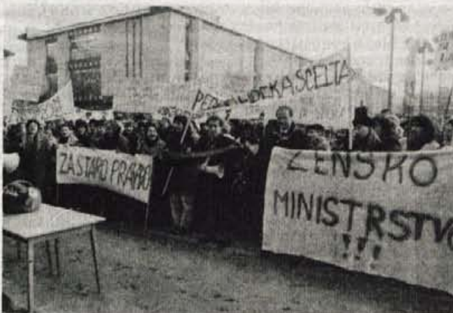
Ljubljana, 11. decembra - Pred poslopjem slovenske skupščine so se v sredo popoldne zbrale ženske in izrazile svojo nejevoljo nad prizadevanji, da bi iz ustave črtali člen, ki govori o svobodnem odločanju o rojstvu otrok, vključno s pravico do splava. Da je materinstvo individualna odločitev ženske (para), pa govori tudi politični plakat, ki ga je te dni izdala Liberalno - demokratična stranka, oblikoval Ranko Novak iz Studia Znak, natisnil pa Gorenjski tisk v Kranju. »Materinstvo ni poslanstvo, niti poklic, ampak moja odločitev!«

In še o argumentu, da bi se s črtanjem ustavne pravice o svobodnem odločanju o rojstvu otrok približali zahodnim demokracijam. Eva Bahovec je dejala, da gre v tem primeru bolj za približevanje vzhodni Evropi, saj pregled pravne ureditve v razvitih državah kaže, da gre v smeri liberalizacije splava in ne obratno pot kot zdaj pri nas