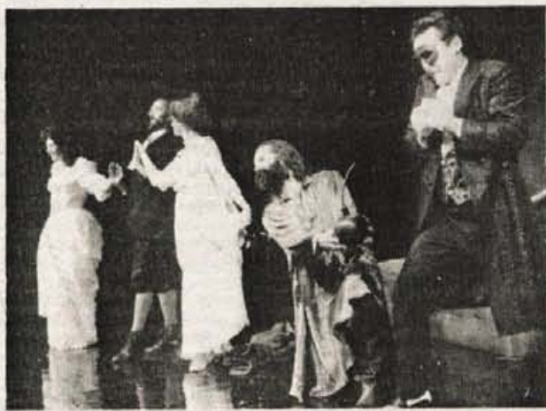
Gledališče v finančni slepi ulici

Prodaja v druge republike bivše Jugoslavije je postala izvoz, vse več kupcev zahteva spričevala o izvoru blaga, da jim ni treba plačevati carin. Izvozniki na Zahod so na takšna spričevala navajeni, obrazce EUR 1 izpolnjujejo tudi po zadnjih ukrepih EGS, da bi kasneje lahko zahtevali povračila, če bo to mogoče. Za prodajo v druge republike pa je potrebno izpolniti klasična spričevala o izvoru blaga, potrjuje jih Gospodarska zbornica Slovenije, ki ima v Kranju območno enoto za Gorensko. Skratka, preden odpošljete blago, ga opremete tudi s spričevalom, da ne bo prišlo do zapletov na mejah. ● M. V.