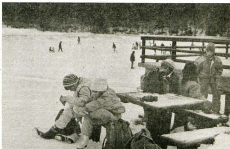
Jezersko, 26. januarja - Planšarsko jezero nad Jezerskim v teh dneh ne sameva, saj njegova zaledenela površina privlači številne drsalce in druge ljubitelje zimskega veselja. Tak vrvež mladih in starejših na jezeru je bil tudi to soboto. Najmlajši počitnic nimajo in so tudi te dni v vrtcu. Posnetek je iz tržiškega Palčka.

Tok sedanje negotovosti se ponekod že usmerja na tisto kolo, ki umirja navajeno vztrajnost za delo, pripravljenost, akcije, reševanje problemov ali pa odlašanje z oblikovanimi opredelitvami, mnenji in možnimi rešitvami vzbuja med ljudmi (vodstvi in krajanji) v krajevnih skupnostih vsaj dve vrsti zaključevanj: ali se gremo skrivalnice, da bi, ko bo napačil pravi trenutek, lažje na hitro "naredili" tako, kot se zdi zdaj načrtovalcem prav; ali pa smo priča nemoči in oceni, da nekdanje napovedi o racionalnosti in ekonomičnosti niso ravno najbolj enostavne... ● A. Žalar