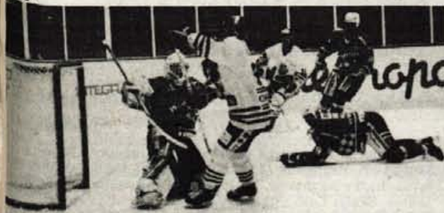
Vso tekmo "trda" igra

Jesenice, 6. oktobra - V nedeljskem derbiju alpske lige so hokejisti Acroni Jesenice gostili svojega starega tekmeca, celovški KAC. Srečanja najuspešnejših ekip svojih dežel so že nekaj pomenila pravi hokejski spektakl in tudi tokrat je bila tekma prava poslastica za štiri tisoč gledalcev v dvorani Podmežaklja. Žal so, po podaljških točki odnesli gostje.