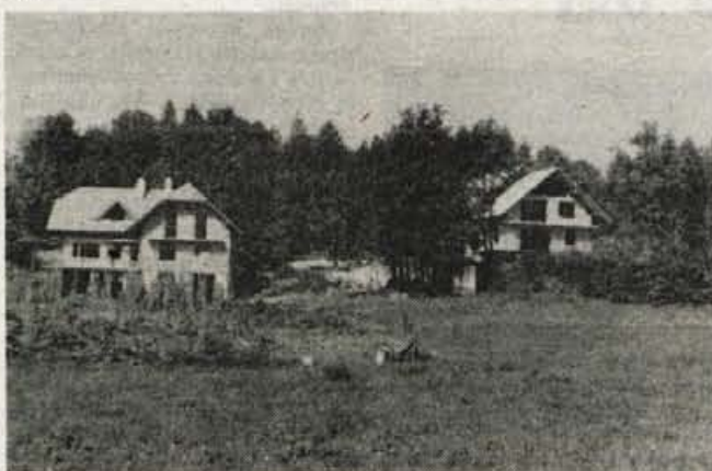
Zazidalni načrt za Kamnitnik je po "zaslugi" Ločanov padel, če bosta padli tile dve črni gradnji na njem, pa bodo taisti Ločani z graditeljema globoko bržkone sočustvovali in kritizirali hudobno oblast...

V končni fazi bo torej izvršni svet presojal, ali izvršba da ali