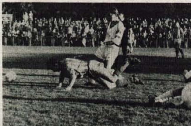
Naklo, 6. oktobra - Nedeljsko kolo v slovenski državni ligi je prineslo novo zmago nogometašem Živil - Nakla. Kljub oslabljeni ekipi (igral ni Taneski) so po borbeni igri premagali ekipo Steklarja in iztržili dve novi točki. Tako s sedemnajstimi točkami ostajajo med najboljšimi tremi ekipami v Sloveniji.

Zakaj je sploh potrebno razmišljati o tem, ko se vse bolj približuje napovedani datum odhoda enot armade iz Slovenije? Zavedati se moramo, da ob čakanju na odhod postajajo živci vojske vse bolj napeti. Vseh nalog v zvezi s predajo objektov in opreme tudi na Gorenjskem še niso sklenili. V takih trenutkih bi bil lahko vsak najmanjši zaplet usoden, zato naj med nami še naprej vladata strpnost in razsodnost! ● S. Saje