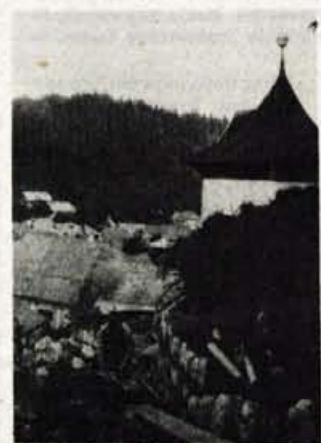
Poleg zadnjega cestnega odseka obnavljajo tudi oporni zid in stopnice proti cerkvi

referendumskega programa na podlagi samoprispevka."