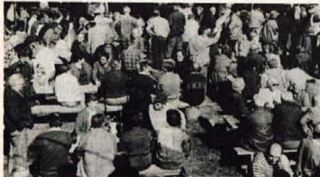
Sklepna svečanost v Gozdu