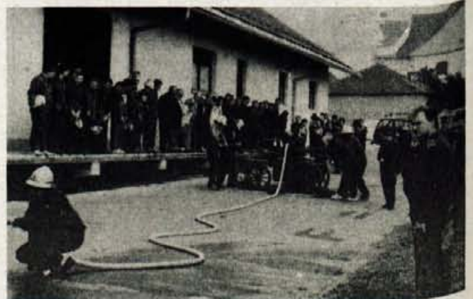
Na tekmovalju za Barletov memorial je zmagala tretja ekipa GD Zgornji Brnik

V soboto, 12. oktobra, bo gasilsko društvo Cerklje v okviru meseca požarne varnosti v gasilskem domu v Cerkljah organiziralo tudi pregled hišnih gasilnih aparatov. Za območje GD Cerklje in sosednjih društev bodo aparate pregledovali od 8. do 14. ure. ● A. Žalar