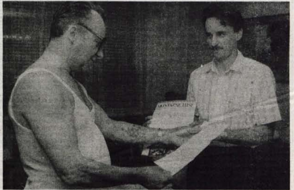
Gorenjski sejem smo sklenili z žrebanjem nagrad našim naročnikom

Dosedanje razprave o predlogih treh najpomembnejših "lastninskih zakonih" (o lastninskem preoblikovanju podjetij, o denacionalizaciji in o zadrugah) so dale toliko različnih pripomb, kritik in mnenj, da pri skupščinskem odločanju ne bo mogoče igrati na karto strankarskega soglasja in da bodo zakoni verjetno sprejeti šele tedaj, ko bo, kot je bilo tudi slišati v razpravi, "parlamentarna logika" (Demosova večina) opravila svoje. Je to dobro ali slabo, bodo "generali" najlaže ocenili po bitki; sliši pa se nenavadno, da je bilo za sprejetje državnih simbolov potrebno strankarsko soglasje, izraženo z dvotretjinsko večino, za odločanje o izjemno pomembni lastninski reformi, pri kateri bo napake zelo težko popravljati, pa bo dovolj že "navadna večina". ● C. Zaplotnik