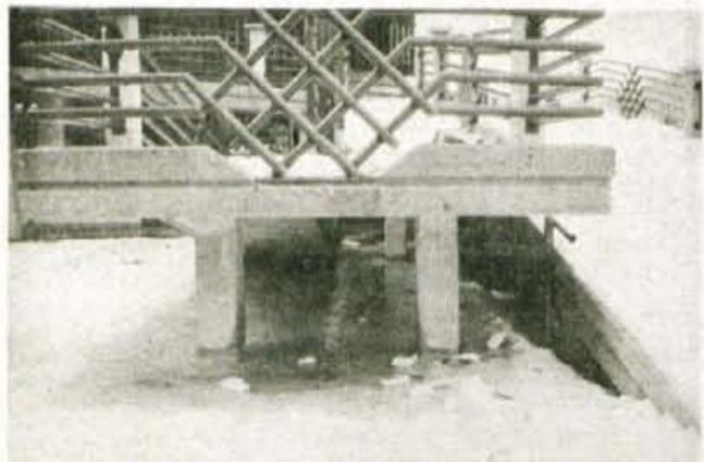
Ob kranjskogorskem Turistično - gostinskem centru je več smeti kot obiskovalcev.

Da Kranjska Gora še vedno ne živi s turizmom, so dokaz tudi v soboto popoldne in nedeljo zaprte banke in večina trgovin, čeprav so najpodjetnejši trgovci že spoznali nujnost in podaljšali (oziroma razdelili) delovni čas. Dokaz, da domačini športnih prireditev niso vzeli za svoje, pa je tudi, da so se tako decembra, kot te dni jeseniški šolniki odločili in organizirali športne dneve le nekaj dni pred in po podkorenjski tekmi na petkovih tekmah pa skorajda ni bilo gledalcev. ● V. Stanovnik