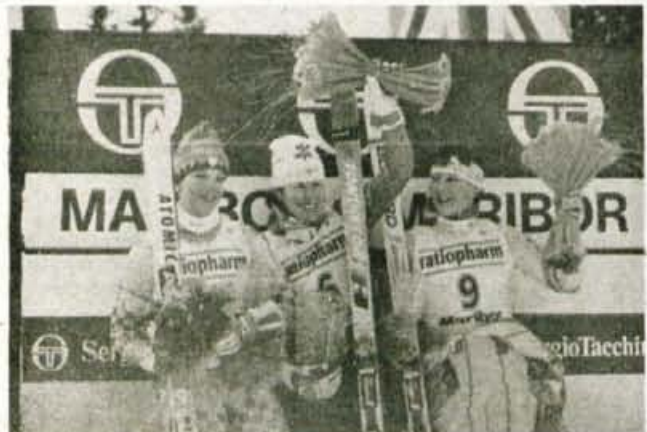
Kdaj bomo lahko rekli: "Nasvidenje športniki - dobrodošli turisti?"