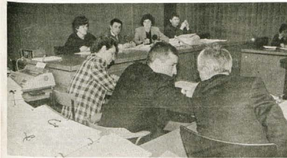
Končan preizkus Elanovih terjatev v stečajnem postopku