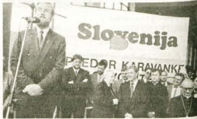
Predsednik IS R Slovenije Lojze Peterle: Najlepši trenutek, ko sta si delavca skozi majhno odprtino podala roki; zdaj pa povezava za prijatelje z obeh strani...