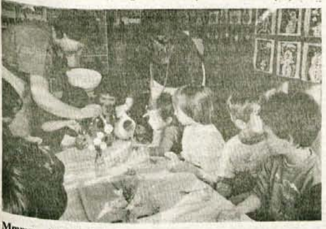
Mmmm... kako je dobro!

okusnega sadnega napitka deležna tudi s fotoreporterjem. Treba jim je priznati: res so mojstri! ● D. Z. Žlebir, Foto: G. Šinik