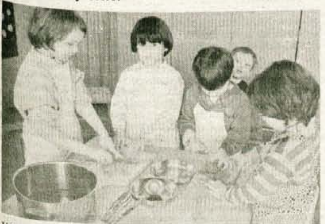
Vsi sodelujemo pri sladkem obredu.