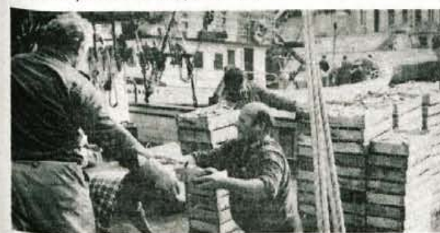
Vsako jutro se v luko vračajo ribiške ladje. Te dni je bil ulov bogat.

Zadovoljen je. Zal mu je le, da hotel Narcis nima ogrevanja in mora biti čez zimo zaprt in hudo jim manjka tistih nekaj deset sob šestega in sedmega nadstropja v Hedri, ki so prav tako brez ogrevanja. Kdo bi si pred dvajsetimi leti mislil, da bodo prav zime v Rabcu tako obiskane. Mimoza, ki je vabljava še posebej zaradi plavalnega bazena z morskovo vodo, je razprodana za ves december. Prejšnji teden je prišlo vanjo stošestdeset gostov iz Šibenika. Prav ste prebrali. Z morja na