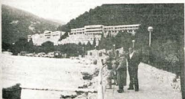
Moderni hoteli, idilične peščene plaže, kilometri in kilometri sprehajalnih poti, mehak zrak, ki blaži astmatične težave - to je Rabac.