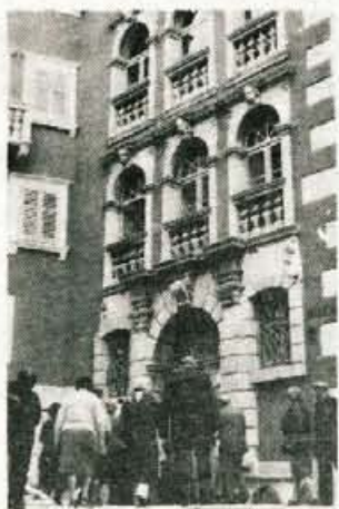
Zgodovinsko zanimiv je bližnji Labin, ki prča, da je bila nekoč tu doma visoka kultura, mestece pa je preveval svobodnjaški duh.

zapiskih ni mogel prehaliti lepot in dražesti zalivov in zalivč-