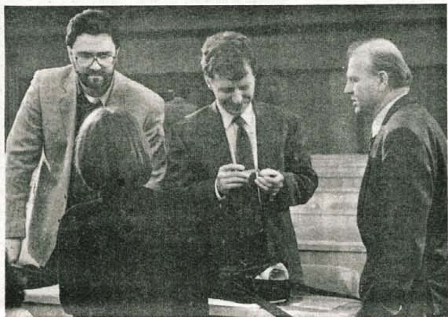
Iz slovenske skupščine