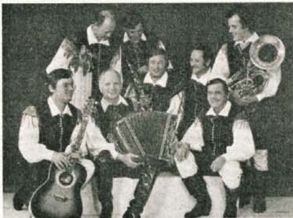
S Slaki se boste lahko pogovarjali v živo. Telefonska številka bo 69-214.

Jutri, v sredo, 24. oktobra, bo na valovih Radia Žiri, ki oddaja na UKV območju 98,2 MHz (za Žiri in Poljansko dolino), na 91,2 MHz (za Škofjo Loko in okolico) ter na 96,4 MHz (za Selško dolino), poslušalce presenetilo nekaj novosti. Oktobrska oddaja v ritmu valčka in polke, ki prinaša mozaik vižarskih novic in svežih novitet, bo namreč potekala V ŽIVO! Obisk v studiu in seveda pogovor s obljubljeni predstavniki slovitega narodnozabavnega ansambla Lojzeta Slaka, poleg njih pa tudi vokalni kvintet Fantje s Praprotna.