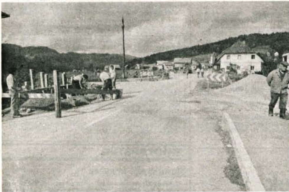
Skozi pretežni del Žirov že pelje lepša in varnejša cesta s pločniki. Do srede novembra bo zaključen odcep do gasilskega doma na Dobračevi ter razširjen most čez potok Rakulka.