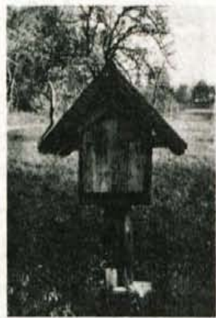
Leseno vaško znamenje stoji nad Beštrom, ob poti na Popovo.

Telefoni imajo, vodo tudi. Zgornji, Beštrovi in Boštškovi imajo svoj vodovod, spjeljan s Popovega. Prav svoj izvir imajo, že od leta 1920 menda. Boštškov stari oče ga je nekako "priženil". Cotlno s Popovega je vzel za ženo in da bi hči ne šla na domačijo brez vode, oziroma domačijo, ki ima probleme z vodo, je dovolil, vzeti njihovo. Tako rekoč je prišla k Boštšku voda z doto. In ker sta bila Bošt in Bešter prijatelja, jo je dobil še Bešter. Sicer so pa za vso vas vlekli vodovod pred kakšnimi štirinajstimi leti