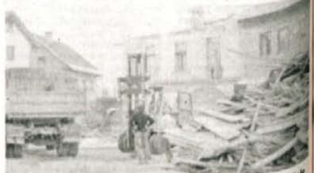
Ali bodo gasilci ostali sami tudi pri prenovi doma?

Kljub angažiranosti pri gradnji ne zanemarjajo strokovnih nalog. Vsak mesec pripravijo vajo z različno vsebino, za njimi je tudi meddruštvena vaja v organizaciji radovljiških gasilcev. 23. oktobra pa bodo pri radovljiški šoli izvedli tekmovanje za radovljiški sektor, v katerem je povezanih 15 gasilskih društev. ● S. Saje