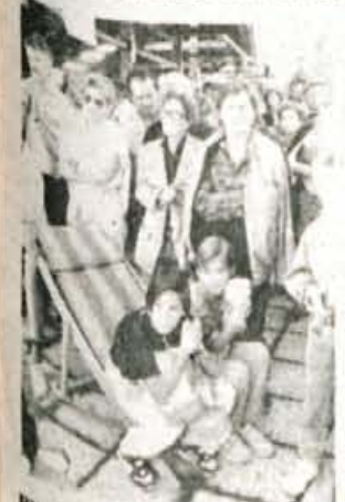
Bliizu 3000 ljudi se je zbralo na shodu na Šmarjetni gori.