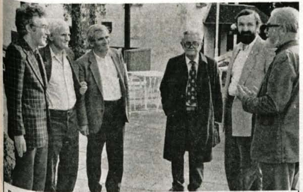
Preddvor - Če velja, da ostaja slovenska knjiga temelj nacionalne identitete, ključ, ki odpira pretek znanja k nam in od nas navzven, potem imajo brez dvoma pri tem kar dobršen in tudi pomemben delež slovenski književni prevajalci. Tokrat so na svojem rednem delovnem srečanju, že šestnajstem po vrsti, razpravljali na temo prevoda kot estetskega fenomena, spomnili pa so se tudi Linharta kot prevajalca in prirejevalca. - L. M.

Kongres se bo začel jutri, v sredo, ob 10. uri s sejo organizacijskega odbora in nadaljeval ob 15.30 uri z otvoritvijo in plenarnim delom. V četrtek bo delo v antropološki, metodično didaktični in metodološki sekciji, simpozij pa bo končan v petek, 5. oktobra, ob 13. uri. ● V. Stanovnik