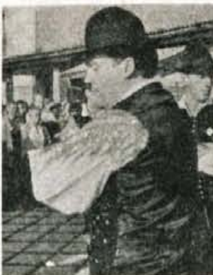
Nastop folklorne skupine z Visokega.

mo pred novo selitvijo narodov, sprožili smo postopek za izdelavo slovenskega potnega lista, ki ga bomo imeli poleg jugoslovanskega, nimamo pa grba, v katerega bi kazalo vnesti kranjskega orla, celjske zvezde in primorsko ladjo. Dr. France Bučar, predsednik slovenske skupščine je dejal, da je oblast nova, stvari pa se še niso spremenile. Po njegovem mnenju so ključni problemi javni mediji, kjer stare sile še niso popustile, kadrovska politika, kjer se mora negativna kadrovska selekcija nadomestiti s pozitivno, vendar z drugačnimi metodami, brez zakulisnih iger, pa državne strukture. Tu ne sme biti nepremišljenih potez, saj je treba ob podiranju stare zgradbe graditi novo. Bodo socialni problemi, nanje računa opozicija, da pride spet na oblast,