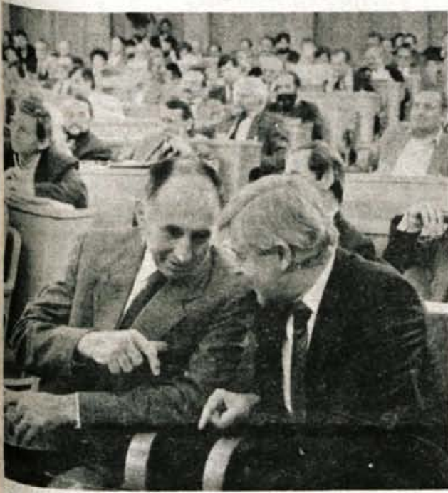
S petkovega zasedanja republiške skupščine. Spredaj član predsedstva republike Ivan Oman in predsednik predsedstva Milan Kučan.

Ljubljana, 2. oktobra - Slovenska skupščina je v petek razglasila dopolnila k slovenski ustavi, ki uveljavljajo pri-