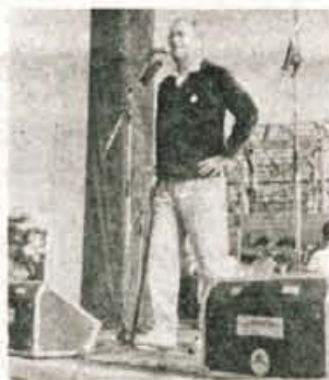
Ob govorniškem odru je bila slovenska zastava, tokrat brez zvezde.

Dr. Dimitrij Rupel je v svojem govoru med drugim povedal: od vsega začetka je usoda stranke povezana z usodo Slovenije, Slovenska demokratična zveza je zveza Slovencev za demokracijo, ki je stalno verjela, da bo v Sloveniji demokracija in da bo Slovenija samostojna država. Smo bili in smo sredi ognja kritik, zato pa smo sredi nastajanja nove države. Politika stranke je glede verskih in ideoloških vprašanj neopredeljena, motiv sta svoboda in svobodnjaštvo, zveza je zoper totalitarizem in jugoslovanski centralizem. V stranki je prostora za vse, za delavstvo, ki ga danes predstavlja srednji sloj, pa za podjetnike. Prihodnje leto ne bomo več živeli v stari Jugoslaviji. S tem ne bomo naredili nič škodljivega. To je samo eno od osvobodilnih