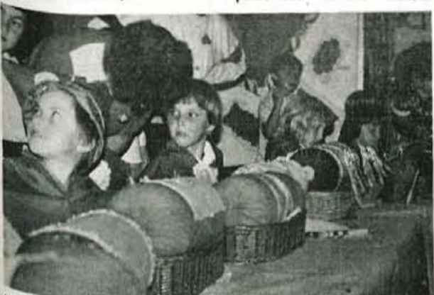
Dokler bo za punkeljne mladih rok, se tudi za čipke ni bati.

Osrednji program festivala se bo pričel ob 13. uri z nastopom mažuretk in folklornih skupin, uro kasneje pa bo na "Starem placu" koncert pihalnega orkestra idrijskih rudarjev. Ob 15. uri se bo na istem prizorišču začelo množično