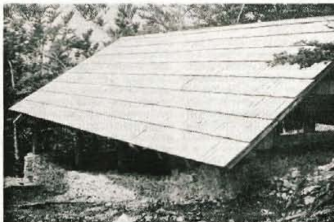
Nad zanimivo arheološko najdišče na Ajdni nad Potoki so postavili veliko streho in ga tako zavarovali...

Po letu 1981 pa so dela na Ajdni prevzeli arheologi pod vodstvom Milana Sagadina iz Zavoda za spomeniško varstvo in ustanovljen je bil odbor za zavarovanje najdišča na Ajdni. Za Ajdno je bilo namreč treba ustrezno poskrbeti in urediti najdišče. Arheologi, med njimi tudi Janez Meterc iz Zirovnice, so delo odlično opravili.