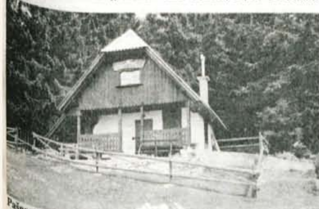
Pašna skupnost je poskrbela, da so s številnimi prostovoljnimi urami obnovili tudi propadajočo kočjo na Potoški planini...

Tisti, ki tako mislijo, so tudi proti temu, da bi planine buldožirali - planine se morajo po njihovo, kot so se včasih. Tudi Potoška planina so zravnali, ni se posebej zrasla, pretekla neurja pa so posebej na spodnjem delu napravila še danes vidne grebene.