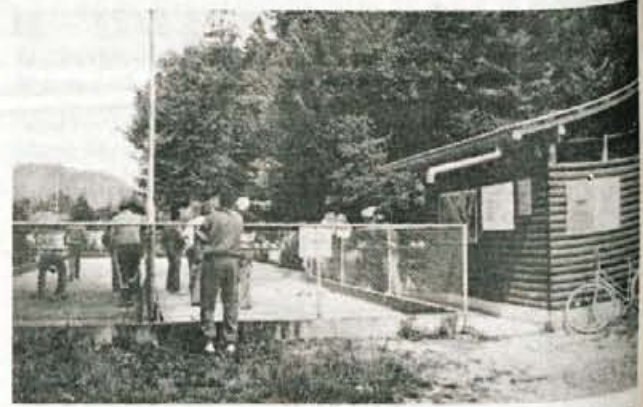
V petek, po slavnostni seji, ko so športniki dobili kombi, so v športnem parku svečano odprli tudi nov večnamenski objekt...

športnih objektov in razvejanjo športno dejavnost. Imamo nogometno igrišče, dve balinišči, štiri tenis igrišča, pa igrišče za kosarko in odbojko. V nekdanjem naselju so asfaltirane v glavnem vse ceste, urejena je Zasavska