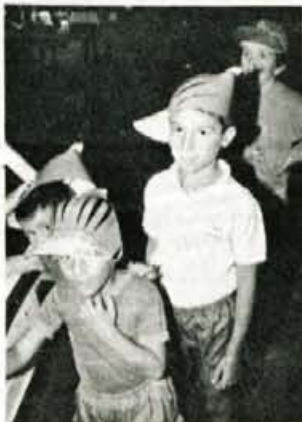
Mladi so "razgrabili" Glasove kapice