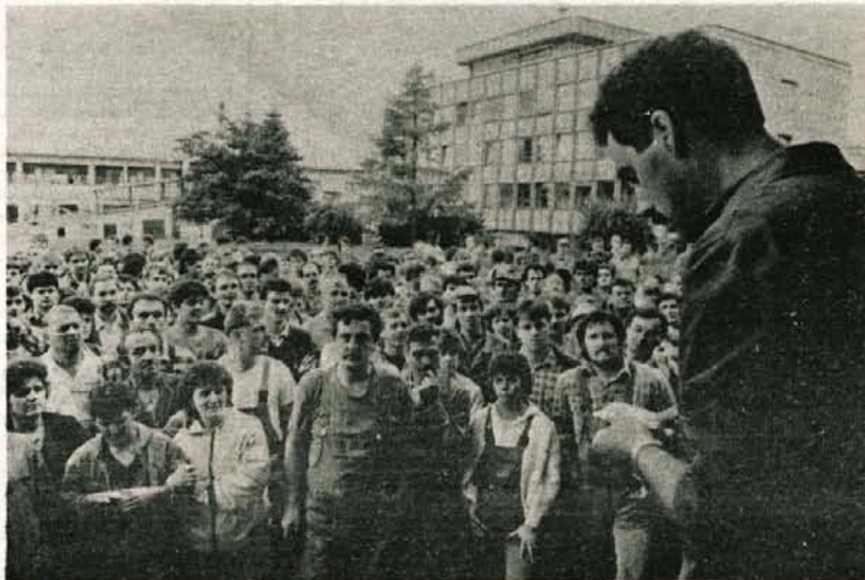
Štrajk v Elanu