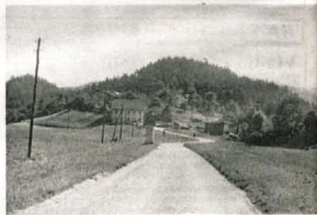
Osrednji del Nemilj, s kužnim znamenjem in gostilno v ospredju.