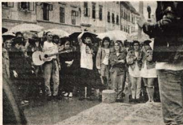
Guadeamus igitur... Kaže, da so letos z maturantskimi sprevodi na Gorenjskem začeli škofjeloški gimnazijci; ta torek so kljub dežju glasno zavzeli "plac", se v verzih poslovili od svojih profesorjev, in predali ključ tretjim letnikom.