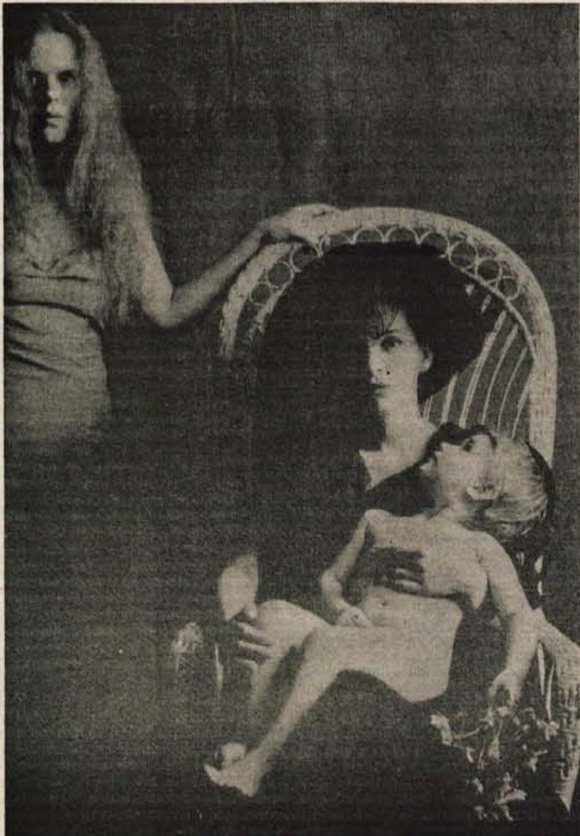
ILUZIJA BESED, avtorja Barbara Jakše, Stane Jerič

2. Razstava bo imela dva poudarka: preteklost Bleda in zgodovina Slovencev. O prvem se z drugimi besedami: z razstavnimi panoji pri oknih bo ob zunanjih stenah muzejskih prostorov nastala zbirka krajevnih zgodovin. Od njihovih podrobnosti bo obiskovalca vodila pot k splošnemu pregledu mimo razstavljenih predmetov iz Blejskega kota, ki bodo v sklopih umeščeni večinoma sredi razstavnih prostorov. Njihov pomen v kulturi in zgodovini Slovenije ter slovenskega naroda bo predstavljen v kronološkem zaporedju z razlagalnimi prikazi na notranjih stenah muzeja. Ti prikazi se bodo združevali v ilustrativen pregled zgodovine Slovencev, kar bi bil drugi poudarek na razstavi. —