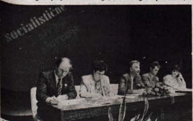
Rodila se je Slovenska socialistična stranka. Ustanovni kongres je bil v soboto v cankarjevem domu v Ljubljani.