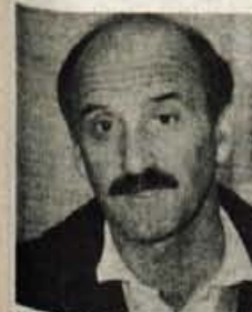
»Ceno osnovne oskrbe v našem domu, ki za bivanje v enoposteljni sobi dnevno znaša 104 dinarje, sem primerjal s cenami v hotelih B kategorije v Sloveniji, ki se gibljejo od 400 do 500 dinarjev. Vendar je razlika v zasedenosti: njihove zmogljivosti prav gotovo niso zasledene prek 90 odstotkov, tako kot so naše. Po drugi strani pa sem si ogledal tudi ekonomske cene, ki veljajo v vrtcih, ki so tako kot domovi družbene ustanove. Za otroke od 2 do 7 let je ekonomska cena 5211 in za jasli 6700 dinarjev, torej so tudi dražji kot mi.«