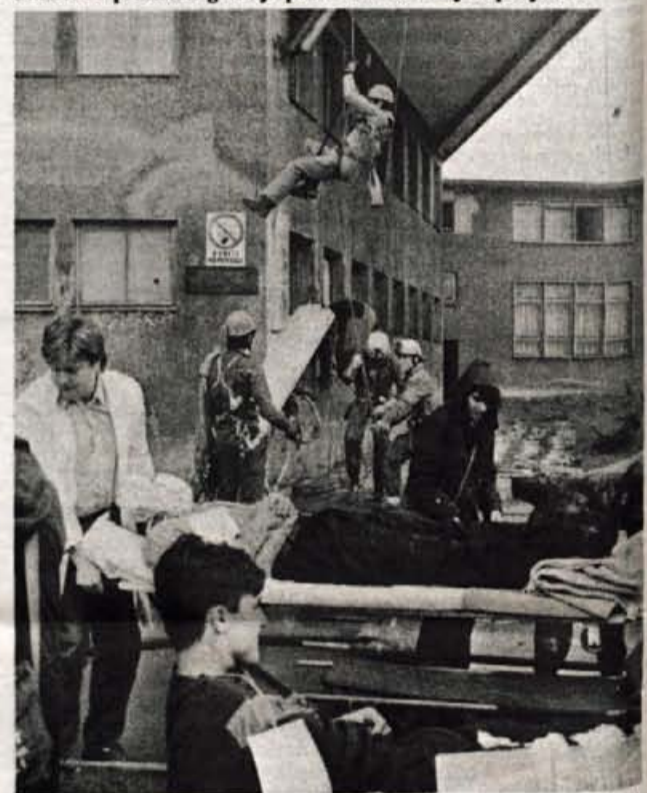
...gorski reševalci so na vaji pripravili s kondicijsko pripravljenostjo in izredno strokovno usposobljenostjo.