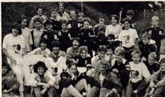
Plavalci kranjskega Triglava so se v soboto zvečer zbrali na družabnem srečanju, na katerem so najboljšim podelili klubska priznanja.