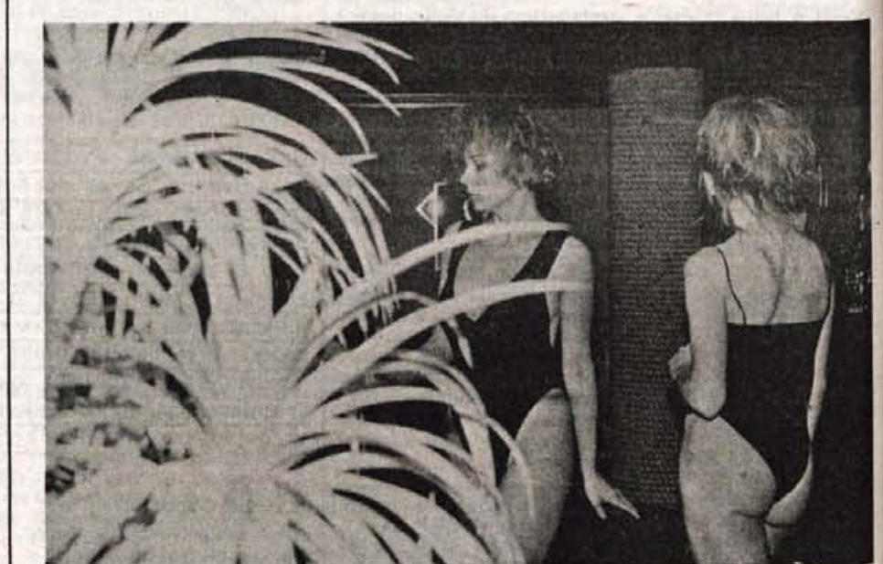
V črnem...

Obsojen si bil na dve leti in pol. Tožilec se sprva s kaznijo ni strinjal, rekoč, da je premila. Vprašali so me, kaj bi naredil, če bi prišlo do vojne in povedal sem jim, da bi ravnal enako kot takrat, še bolj gotovo bi to naredil. Saj v vojski res ponavadi nikogar ne ubiješ, čeprav se po mojem tam učiš ubijanja. Ko pa pride do prave vojne, takrat je ubijanje prvo pravilo. Vedel sem, da si s tem odgovorom lahko prislužim še kako leto zapore več. Toda povedal sem jim tudi to, da se mi zdi bolj pošteno, če jim o tem, da nisem pripravljen ubijati, povem se-