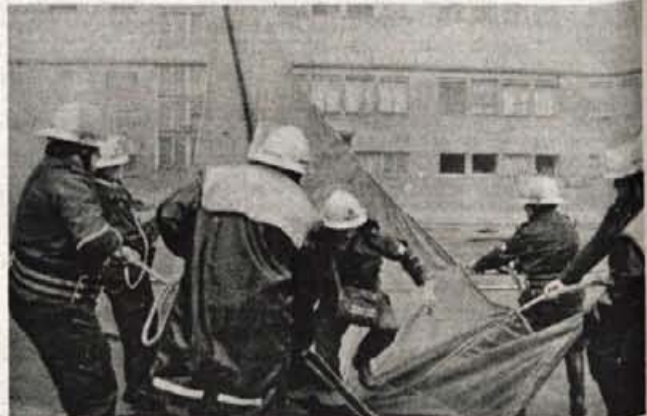
Gasilci so prikazali gašenje požara in reševanje s ponjavo...

Ekipe so vsaka zase prikazale, da teoretično znanje in usposabljanje obvladajo in bi ob morebitni nesreči znale uspešno in učinkovito pomagati in reševati. Žal je slabo vreme v sredo popoldne precej razredčilo gledalce zanimive vaje reševanja z višin, iz ruševin, vode, posredovanje ob onesnaženju vode in gašenju požarov. Na vaji pa je osem republiških in pokrajinskih ekip Rdečega križa Jugoslavije v okviru dvajsetega srečanja preverilo tudi usklajeno delovanje in pomoč ob rušilnih potresih. ● A. Ž.