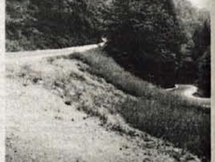
V vaseh Gabrovo in Breznica upajo, da bodo prvi metri asfalta "spodbudili" nadaljnje urejanje ceste...