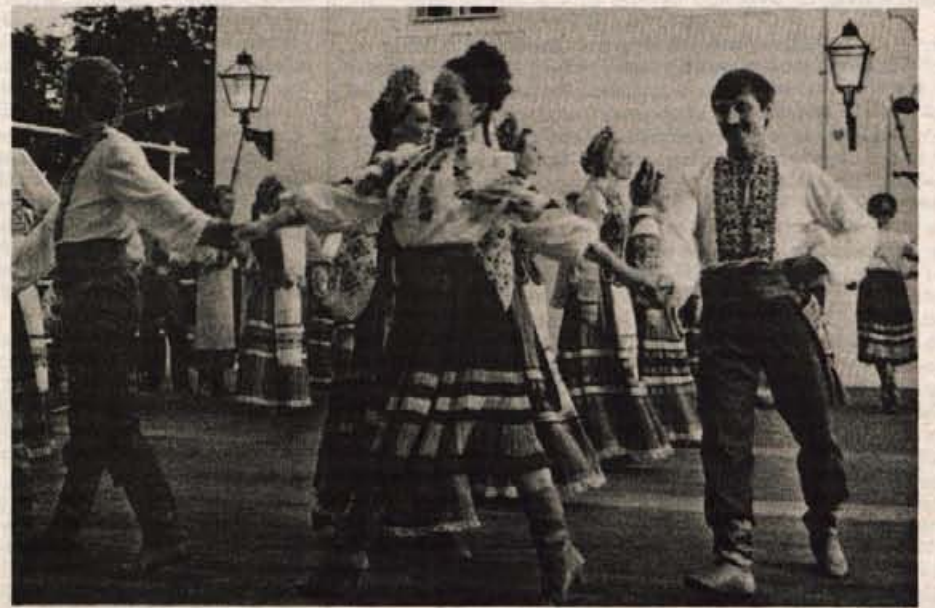
Kranj — Te dni je na gostovanju po Sloveniji folklorna skupina Lionotsvit iz Ukrajine. Plesalci in pevci te skupine, ustanovljene pred 22 leti, so se že predstavili v Kranju, Portorožu in v Ljubljani, jutri, v sredo, pa nastopajo v Festivalni dvorani na Bledu. Ukrajinski gostje s tem vračajo obisk Folklorni skupini Sava Kranj, ki se je pred kratkim vrnila z gostovanja v Ukrajini. — L. M.

Prepričanje, doslej ste vladali vi, poslej bomo pa mi in bodite kar lepo tiho, saj ste bili na oblasti petinštirideset let, lahko označimo le kot neoboljševizem, njegove obrise so najbolj domiselni analitiki že označili s primerjavo Demosa z nekdanjo szdljevo marelo, pod katero demokracija igrajo vlogo avantgarde. Nemara so prehude in velja malce počakati, da se dosedanja opozicija navadi na vlogo pozicije, predvsem, da se navadi na opozicijo, ki sejo lahko zavlačuje tudi zato, da predlagatelja utruji in s tem razkrije morebitne skrite pasti. Toda naš strah pred neoboljševizmom je prav tako razumljiv, še vedno ga imamo v kosteh, saj pregovor pravi, kogar je pičila kača, se boji zvite vrvi. ● M. Volčjak