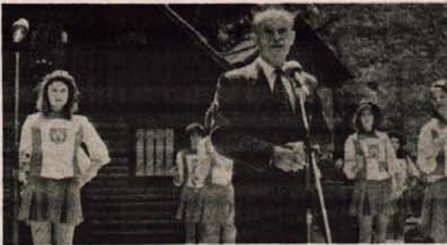
Bohinj, 3. junija - "Turizem je tisto področje, ki lahko brez posebnih investicij pripomore k našem boljšem gospodarskem stanju. Brez kvalitete ni turizma, kvalitete pa ni brez ljudi, ki živijo v turističnem kraju in brez zasebne iniciative," je med drugim povedal slavnostni govornik dr. France Bučar, predsednik slovenske skupščine, na nedeljski otvoritvi poletne turistične sezone v Bohinju. V programu, ki so ga pripravili "Pod skalco", so nastopili tudi Godba iz Gorij, Ljubljanske mažuretko, Ansambel Marela in Moped show, na prireditvi pa je bilo veliko domačinov in gostov.