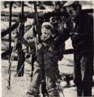
Poskrbeli so tudi za najmlajše, saj je delala tudi otroška vlečnica.