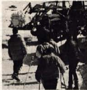
S traktorjem takole dovažajo sneg tja, kjer ga najprej zmanjka, nujno je potreben ob prečnju.