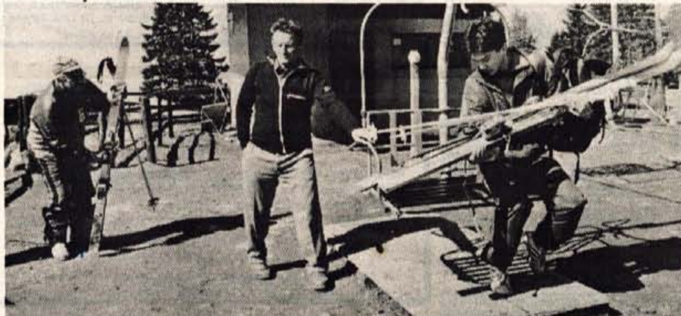
Najprej peš s smučmi v rokah, do prvega zavoja na snegu.