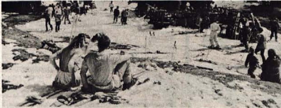
Središče pomladanske smučarije na Krvavcu. Čakalnih vrst ni bilo nikjer, ne za dvosedežnico proti Zvoheru, ne pri gostincih. Vsi pa so bili zadovoljni.