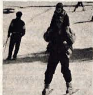
Tudi na ramenih se je zanimivo smučati.