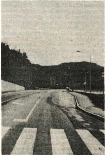
Največji zalogaj je bila lani mestna vpadnica od Peka do BPT...

prav nič skromnejši od lanskega. Za zdaj, kar zadeva denar, dobro kaže. Če se med letom ne bo zataknilo, potem bo konec leta v občini in vseh področjih precej narejenega.