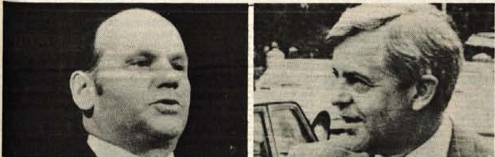
Slovinci smo se množično udeležili volitev

ljubljanska banka Gorenjska banka Kranj GORENJSKA BANKA FORMULA PRIHRANKA