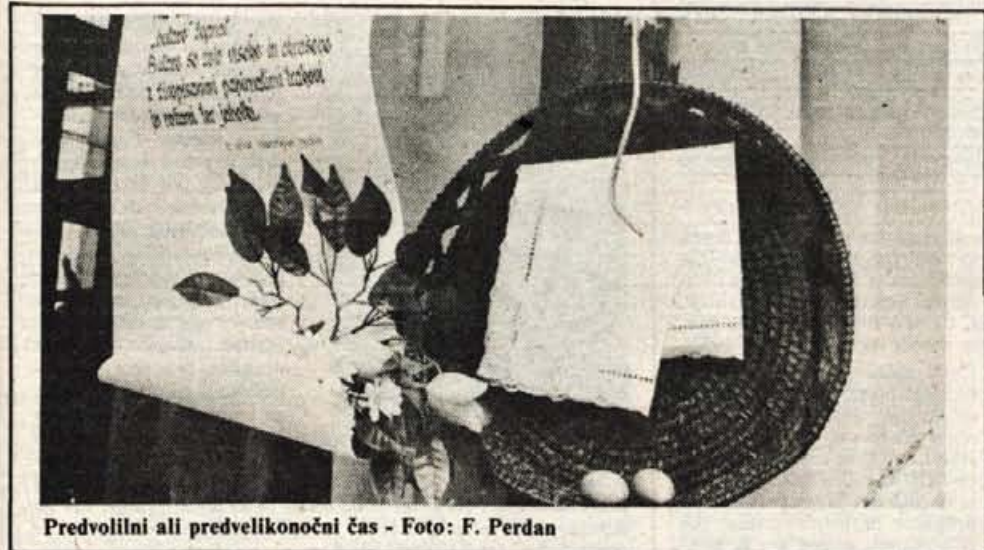
Predvolilni ali predvelikonočni čas

Za volilce bo po volitvah od volilnega golaža ostala samo omaka. Govorimo o spravi, toda najprej naj vsak lepo pospravi pred svojim pragom. Po odcepitvi nas čaka novo cepljenje. Bolj kot vpijemo, več je možnosti za dialog gluhih. Pri nas so arhivi zaprti, zgodovinarji pa na prostosti. Vse tiste, ki so nas pustili na cedilu, prosim, da pridejo po izcedek. Izhod smo menda našli, samo vrag je v tem, da je tam blagajna.