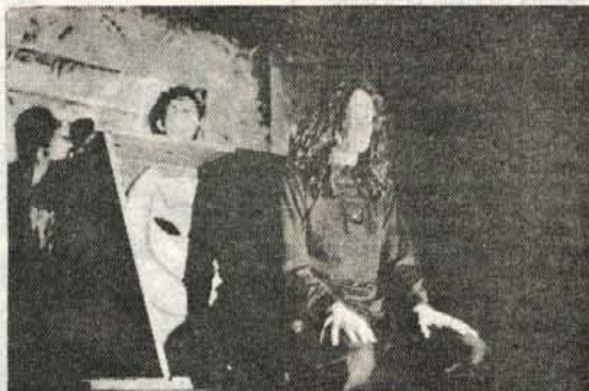
Na Jesenicah je nastopilo tudi kranjsko eksperimentalno Gledališče čez cesto s predstavo Iztoka Alidiča Mars.

Da so mladi gledališki navdušenci širom Gorenjske ustvarili resnično zanimive odrske dosežke, kaže izbor predstav za to srečanje. Repertoar je pester in raznolik tako po ustvarjalni, samobitni, vsebinski zasnovi, kot tudi po izvedbeni odrski realizaciji, ki je mnogokrat polna zanimivih domiselnosti, lahko igrivosti in sproščene igre mladih interpretov. V nekaterih predstavah se kaže domišljija kot neizmeren vir ustvarjalnosti, ki mlade samo potrjuje v njihovi iznajdljivosti, domiselnosti in veselju do igranja in gledališča. Otroška gledališka skupina »Čuki« iz Radovljice je ustvarila popolno avtorsko gledališko predstavo »Pištček«. Besedilo, scena, kostumi, skratka, vsi elementi predstave so plod bogate domišljije omenjene skupine. Prav tako je dramska skupina »Raglje« iz Kranja pokazala veliko mero gledališke iznajdljivosti in ustvarila avtorsko predstavo »Lahko noč, hudo ba«. V gledališču »Tone Ču-