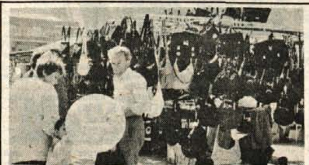
Vsakoletni Jožefov sejem na Jesenicah vedno obišče dovolj kupcev in »firbceev«. Zadnja leta so ga preselili s tržnice v Podmežaklo, kjer pa tudi ne manjka kupcev. Letošnji je bil še posebej dobro obiskan, saj je bilo vse dni lepo sončno vreme. Poleg »kramarije« in kiča pa se je vendarle dalo kupiti tudi kaj koristnega, še posebej so se resni kupci ozirali za grabljami in drugim vrtnim orodjem, semeni in sadikami...

23. februarja, kakšno minuto pred 13. uro je starejši voznik belega fička, spet kranjske registracije, izredno korajžno peljal v prepovedano smer, enosmerne ulice od Begunjske 6 proti Krajevni skupnosti Vodovodni stolp in kljub ponovnemu znaku, da je cesta enosmerna ter ostremu nepreglednemu ovinku okoli bloka, še enkrat pokazal, da je akcija - 10 odstotkov neupravičena in bi morala imeti naziv + 10 odstotkov, glede na korajžno vožnjo pa še kakšen odstotek več. Žal ni edini voznik, ki dobro obvlada to smer.