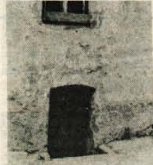
Tole pa je vhod v Gazvo "čevdr".