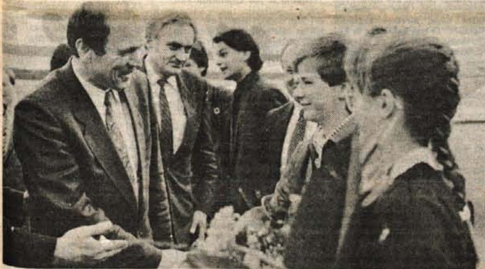
Koristno potovanje po afriških deželah - Predsednik predsedstva SFRJ dr. Janez Drnovšek, ki se je v soboto popoldne vrnil s potovanja po afriških deželah, je srečanje z državnikom ocenil za izredno koristno. Na brniškem letališču je ob prihodu na tiskovni konferenci med drugim poudaril, da sta črnski voditelj Nelson Mandela in južnoafriški predsednik Frederik De Klerk močni osebnosti, ki sta sposobni pripeljati začetni mirovni proces do konca...