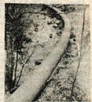
Ob Lomščici se danes od Grahovš vijejo cevi vse do Loma, do nove centrale "Gabrc".