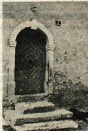
Lepa stara vrata krasijo vhod v Gazvo hišo.

prenočišča, poleti pa tudi na planini Javornik. Kočo si delita Pašna skupnost Lom in Športno društvo Lom. Včasih je bilo