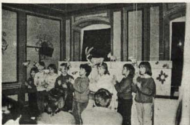
Mladi lutkarji iz cerkljanske šole so uprizorili igrico Volk in sedem kozličkov.