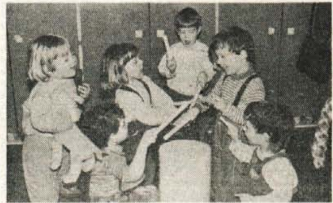
Hrupno dopoldne med malčki.

Na Trati, pretežno delavskem naselju, kamor se je pretekla desetletja priseljevala delovna sila bodisi z okoliškega podeželja bodisi iz drugih delov Jugoslavije,