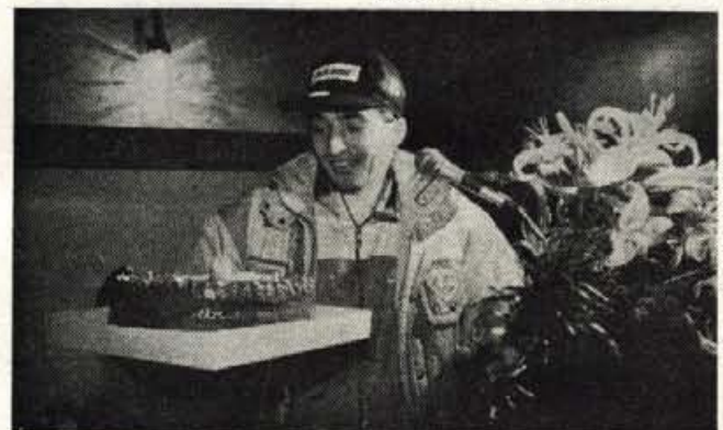
Torta za zmagovalca. Dobil je še veliko presto, pa darilo skakalcev in seveda šampanjec, s katerim je temeljito namočil občinstvo.

"Ko se spomnim nanjo, imam slabo vest. Čisto sem jo pustil. Spomladi bo na prvem mestu. Če človek hoče, zmore vse."