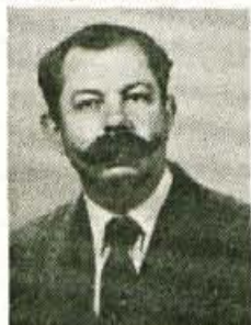
»Smo na meji dveh držav in zato pomembni za prometne povezave. Gospodarstvo večinoma stoji na železarstvu, v prihodnje pa ga je treba tako prestrukturirati, da ne bo slonelo le na proizvodnji jekla. Mislim, da je treba še naprej - zaradi lepote in prirodnih danosti, ki jih imamo - razvijati turizem, v Kranjski gori in okolici. A ne le

»Kakšne možnosti ima jeseniška občina za nadaljnji razvoj, še posebej, ker se v naslednjih letih odpira karavana predor in gradi avtocesta, s tem pa se pomembno spreminjajo Jesenice in njena okolica?«