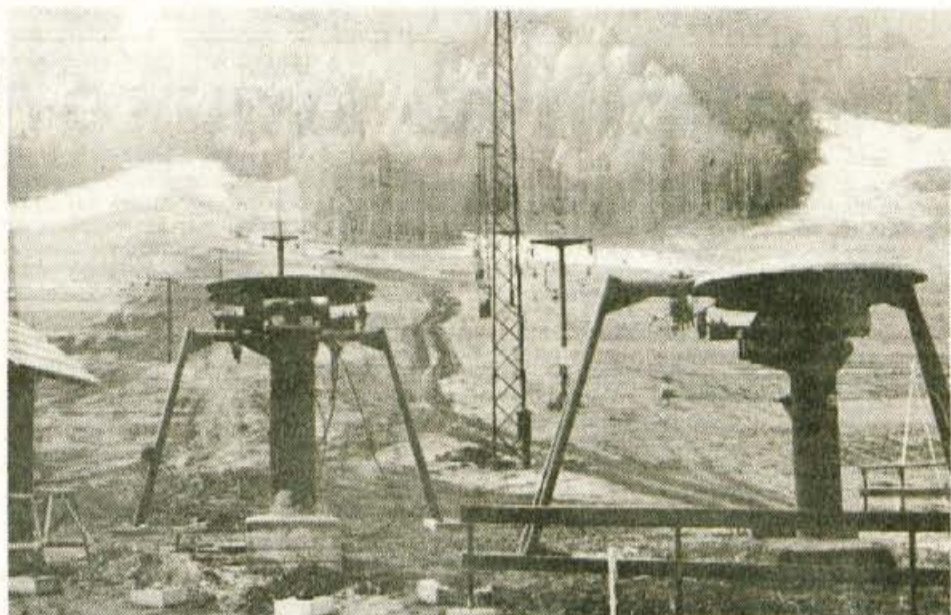
Rožle se imenuje nova vlečnica, ki so jo kranjskogorski žičničarji postavili na smučišču za Larixom.

Minili sta dve zimi, domala brez snega. Smučarji, mladi in stari, začetniki in dobri rekreativci, v teh mrzlih novembrskih dneh že nestrpno spremljajo vremensko napoved: nam bo letos nebo bolj naklonjeno? Bo vsaj v zimskih počitnicah zapadlo toliko snega, da se bodo najmlajši naučili nekaj smučarskih zavojev in zaužili vse veselje in radost, ki jo ponujajo bele snežne poljane?