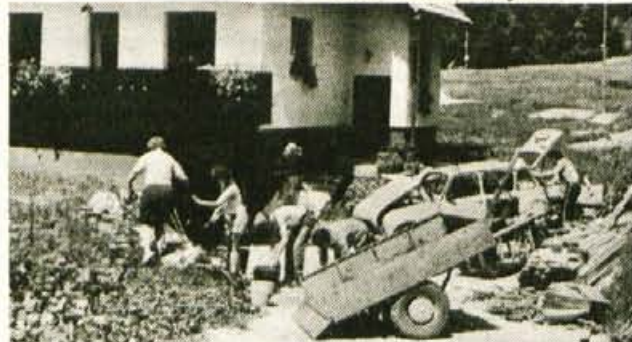
Precejšnje razdejanje je naredila voda pri Meškovich...