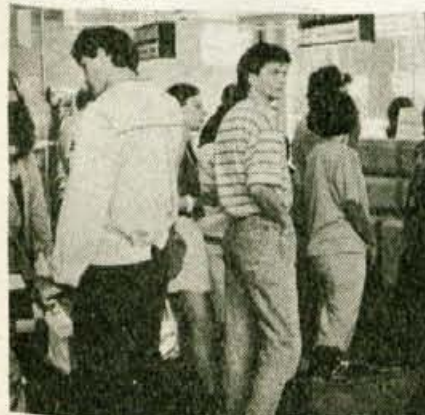
Pristaniška stavba je že dolgo pretesna, v teh poletnih dneh je gneča največja ob ponedeljkih in torkih.

"V petek, 28. julija, bo investicijsko zasnovano obravnavala republiška komisija. Temeljna banka v Kranju je že dala pozitivno mnenje, bančni inštitut pri združenih banki prav tako."