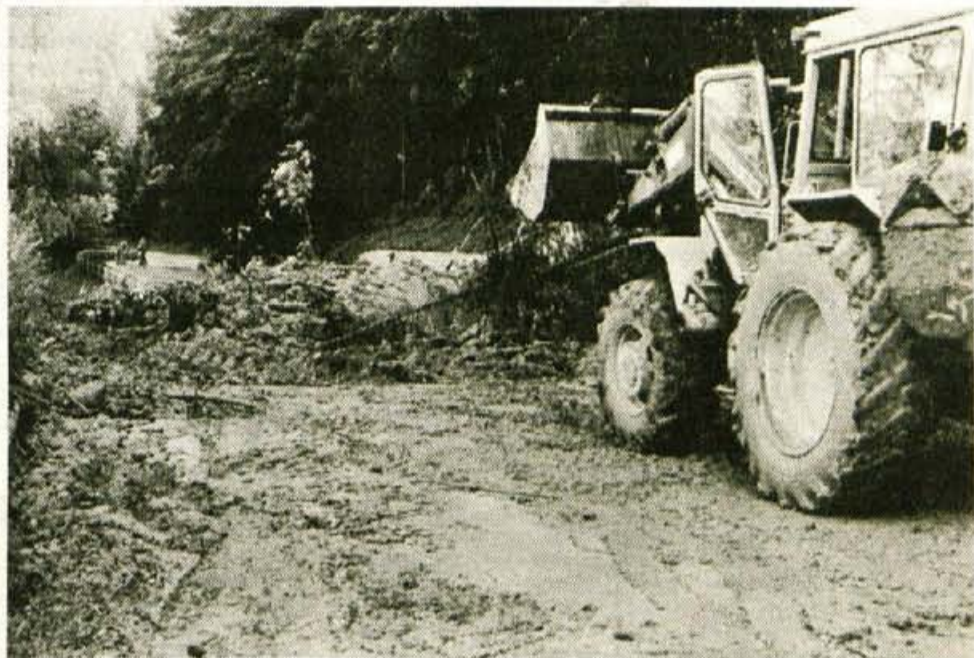
Huda ura na Jezerskem - V ponedeljek, ko se je večer prevesil v noč, so Jezerjani začeli doživljati hudo uro, kakršne ne pomnijo niti najstarejši. Nevihta je divjala predvsem na območju Zgornjega Jezerskega. Na cestah, v stanovanjih, pri jezeru... je puštošila voda, proti Jezerskemu vrhu pa so na cesto zgrmeli zemeljski plazovi. Več na zadnji strani... - A. Ž.