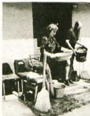
Pri Šajnovih so v torek pomagali tudi turisti in vojaki...