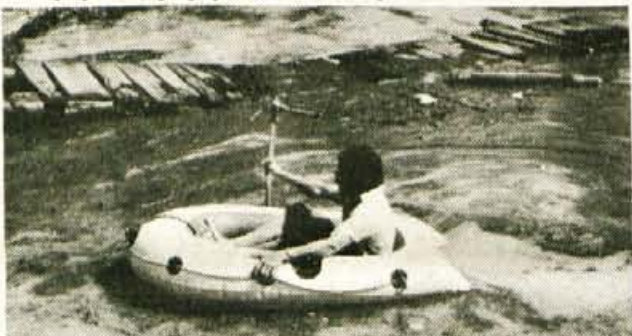
Voda v Planšarskem jezeru se je razlila čez zapornice, kotanjo jezera pa napolnila z blatom...