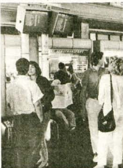
Pred kratkim so na letališču uvedli računalniško podprt informacijski sistem, ki točno in natančno obvešča potnike o prihodih in odhodih letal ter zamudah.

"Kolikor imam stikov z direktorji, mislim da. Verjetno mislite na financiranje."