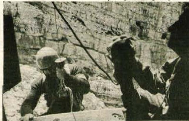
Vrata, 24. julija - Trinajst gorskih reševalcev letalcev, med njimi so bili tudi štirje zdravniki, so s piloti letalske enote milice RSNZ z Brnika v petek preskusili reševalske večerine v severni triglavski steni. Več o tem na 11. strani.