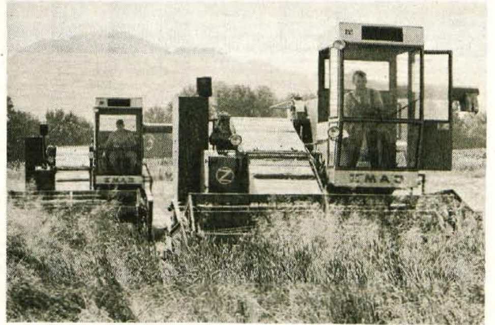
Kranj, 21. julija - Na Gorenjskem so minuli teden začeli žeti pšenico in druga žita. Ker je precej pšenice poleglo, gre delo zanjcem nekoliko počasneje od rok. Pridelek bo kar dober, sicer pa "nežne sorte" v gorenjskih podnebni in vremenskih razmerah ne uspevajo najbolje. C. Z.