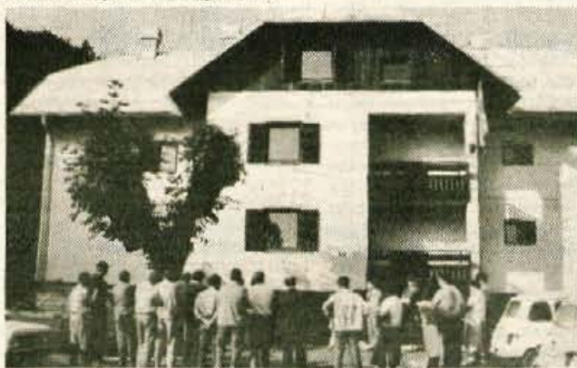
S končano gradnjo na Flegariji in pred tem na Jaršah je bilo na Bledu zgrajenih okrog 100 stanovanj. Sicer pa trenutno poteka glavna gradnja v radovljiški občini v Prešernovi ulici v Radovljici...

Radovljica. Investicijska vrednost celotnega objekta znaša dobro milijardo dinarjev, kva-