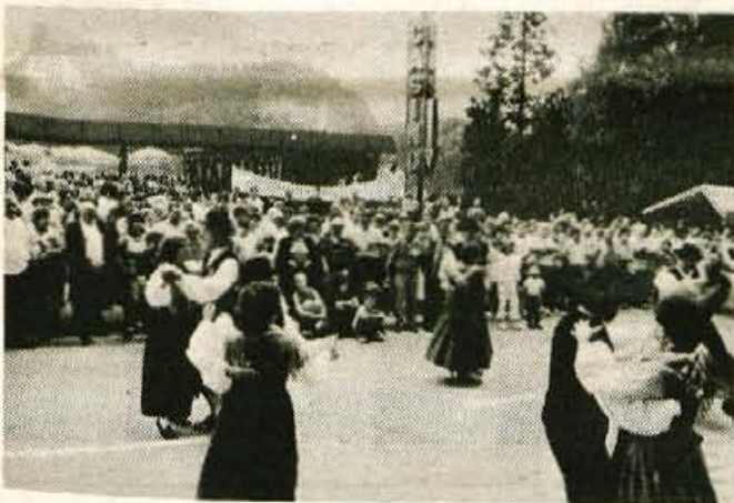
Bled, 22. julija - Blejska noč je bila tudi letos dobro obiskana. Kot ocenjujejo, si jo je ogledalo 40 do 45 tisoč ljudi, ki so se na Bled pripeljali s skupno 20 do 25 tisoč vozili.