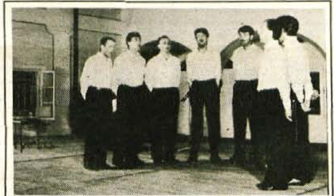
Minuli petek je bil na Gorenjskem v znamenju kulturnih dogodkov. Prav v vseh občinah so v večernih urah pripravili različne prireditve. Na Jesenicah, v Trzinu in Radovljici so odprli galerijska vrata likovnim skupinam Relik iz Trbovelj in Dolik iz Jesenic, Dragu Tršarju ter Janezu Lenassiju. Obiskovalci pa so si lahko ogledali tudi tri prireditve iz Skofjeloških poletnih večerov, Radovljiškega poletja oziroma kranjskih Kieselsteinskih večerov, od koder je tudi fotografija Gorazda Šinika. (V. B.)