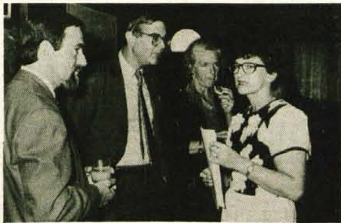
Brdo pri Kranju, 18. junija - Center za usposabljanje vodilnih delavcev pri Gospodarski Zbornici Slovenije je s sodelovanjem New York State University pripravila poglobljen dvotedenski seminar o mednarodnem marketingu v ZDA. Otvoritev se je udeležil tudi ameriški ambasador v Jugoslaviji gospod Warren Zimmermann (v sredini). Več na 3. strani.