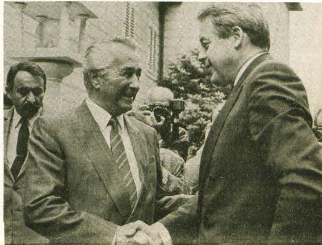
Ob srečanju na Brdu in pod Karavankami