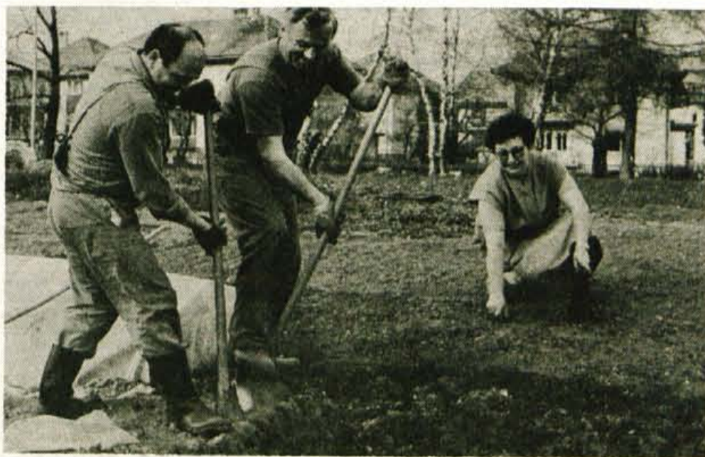
Tudi v mestih naj raste zelenje - Tako razmišlja že veliko tamkajšnjih prebivalcev. Če ni moč pridobivati dragocene zelenjave, bo okolje lahko obogatilo vsaj okrasno rastlinje. (S)