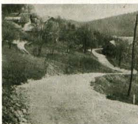
15. junij je rok, ki so si ga zastavili, da bo cesta Murave - Hleviše asfaltirana...