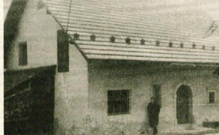
Šekova domačija na Zgornjih Lazah je stara vsaj dvesto let

Na Zgornje Laze danes vodi dobra cesta, vaščani se večinoma z lastnimi avtomobili vozijo na delo v Gorje, na Bled ali na Jesenice. Mladi si postavljajo svoje hiše, spomini pa ostajajo v starih domačijah. Spomini na leta, ko so izredno težko živeli in si iskali kruha na Jesenicah ali na Bledu, a se vedno znova vračali v hrib, domov na Laze. V odmaknjeno vas, kjer zaradi prisojne lege po ves dan sije sonce in od koder je izredno lep pogled na Bled in na njegovo okolico. V kraj, kjer so preživeli težko, a lepo mladost, v kraj, kjer se vsi med seboj poznajo, si pomagajo, kjer se po domače, po »važansko« govori, na Vaze pač, »čer so Medved, Levi, Voki in Tigri doma.«